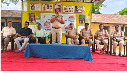
తెలుగు గళం న్యూస్ స్టేషన్ ఘనపూర్, జూన్ 23

స్టేషన్ ఘనపూర్ ప్రభుత్వ పాఠశాలలో డ్రగ్స్, సైబర్ నేరాలపై అవగాహన కార్యక్రమం