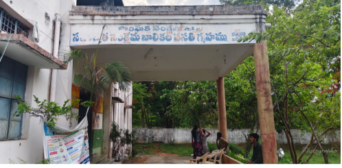
సత్తుపల్లి, జూన్ 23 (తెలుగుగళం న్యూస్)