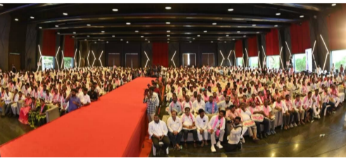
తెలుగు గళం న్యూస్ కాజిపేట్/జూన్ 22