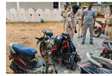
తెలుగు గళం న్యూస్ వర్కాంప్లెక్స్/జూన్ 22 వరంగల్ జిల్లాపరిశోధనా విజ్ఞాన సమీపంలో జరిగిన రోడ్డు ప్రమాద ఘటనా స్థలాన్ని డీసీపీ ఈస్ట్ జోన్, మామూసూరు ఏసీపీ సందర్శించి క్షుణ్ణంగా పరిశీలించారు. ప్రమాదానికి దారితీసిన పరిస్థితులను, సంభాషణ కారణాలను విశ్లేషించారు. భవిష్యత్తులో

ఇలాంటి ప్రమాదాలు జరగకుండా తీసుకోవాల్సిన రోడ్డు భద్రతా చర్యలు, నివారణ చర్యలపై అవసరమైన పరిశీలనలు చేశారు.