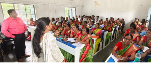
తెలుగు గళం న్యూస్ స్టేషన్ ఘనపూర్, జూన్ 22