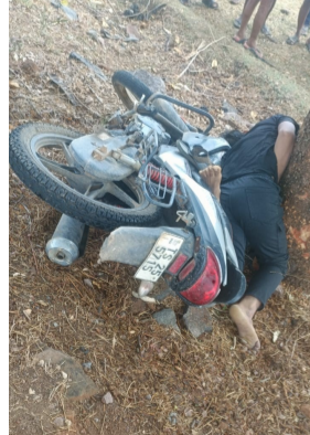
తెలుగు గళం న్యూస్ భూపాలపల్లి కొత్తపల్లి గోరి