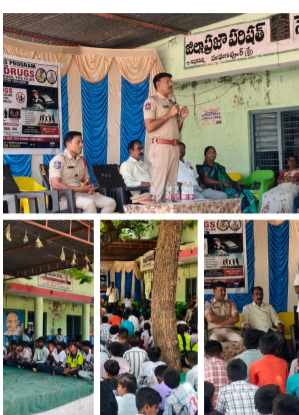
తెలుగు గళం న్యూస్, స్టేషన్ ఘనపూర్, జూన్ 22