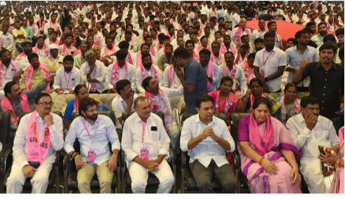
తెలుగు గళం న్యూస్, కాజిపేట్ జూన్ 22 :

ఓటు పై భూతు బి ఎల్ ఓ లకు అవగాహన కల్పించిన బిఆర్ఎస్ పార్టీ వర్కాంప్లెక్స్ కేటీఆర్ ప్రతి ఓటు ప్రజాస్వామ్యానికి బలం --ఓటు హక్కును ప్రతి ఒక్కరూ కాపాడుకోవాలి ఎస్ఐఆర్ పేరుతో ఓటు హక్కులను హరించే బీజేపీ కుట్రలను తిప్పికొట్టాలి ప్రతి తప్పనిసరిగా ఏనుషేషన్ ఫారం నింపి ఓటిల్ల హక్కులను కాపాడాలి