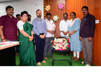
కమిషనర్ తో మాట్లాడారు దీనితో సాయత్రం ఎమ్మెల్యే వాసు ఇంటి వద్ద ఎం హెచ్ ఓ సమక్షం లో సమావేశం జరిగింది. ఈ సందర్భంగా ఎమ్మెల్యే మాట్లాడుతూ కూలమి ప్రభుత్వం కార్మికుల సంక్షేమ కోసం పని చేస్తుందని అన్నారు.కార్మికుల సమస్యలపై మధు, ఎం హెచ్ ఓ లు నిరంతరం నాతో మాట్లాడుతూనే ఉన్నారని తెలిపారు.నేను ఎమ్మెల్యే అవ్వగానే సిబ్బంది కొరత తీర్చాలని దీనికోసం జిల్లా కలెక్టర్ పలుమార్లు చర్చించి నిర్ణయాలు తీసుకున్న తర్వాత కార్మికులు న్యాయం చేస్తున్నారని మీకు ఎప్పుడు అండగా ఉంటానని ఎమ్మెల్యే భరోసా ఇచ్చారు.అంతే కాకుండా ఇప్పుడు పెంచిన జీతాలు క్రమక్రమంగా పెరుగుతూ ఉంటాయని ఆయన పేర్కొన్నారు.