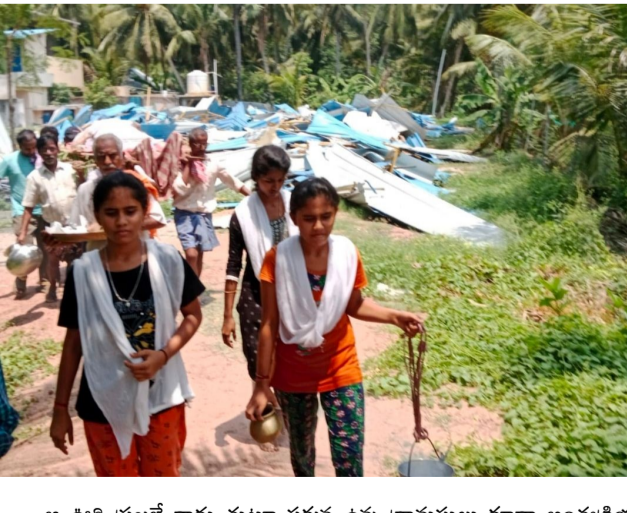
ఆ ఊరి ప్రజలే కాదు చుట్టూ పక్కన ఉన్న గ్రామస్థులు కూడా అంతర్వ్యక్తియలకు హాజరు అయ్యారు.. అందరి మనస్సులు దుఃఖంతో నిండి పోయాయి.