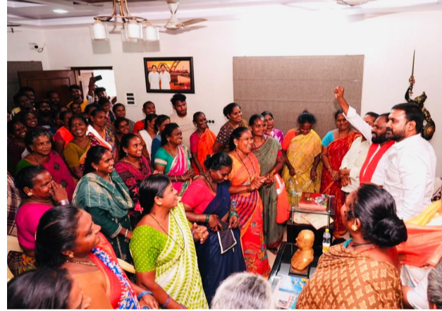
రాజమండ్రి, (తెలుగు గళం) జూన్ 22: రాజమండ్రి మున్సిపల్ కార్పొరేషన్ పారిశుధ్య విభాగం లో 183 మంది రిక్సా కార్మికులు చాలా సంవత్సరాలుగా కేవలం 9 వేలుకే పనిచేస్తున్నారని ఈ సమస్యపై గత రెండు సంవత్సరాలుగా ఏపీ మున్సిపల్ పర్సనల్ యూనియన్ ఏజిటీయూసీ రాష్ట్ర