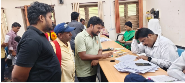
దుమ్ముగూడెం, భద్రాద్రి కొత్తగూడెం జిల్లా, తెలుగు గళం న్యూస్

ఎజెన్సీ ప్రాంతమైన పరకాల నుండి పైడిగూడెం వరకు మధ్యం దండా జరుగుతున్న పట్టించుకోని ఎక్స్జిజ్ అధికారులు, జిల్లా కలెక్టర్, పి ఓ. ఐ.టి.డి.వి. భద్రాచలం భద్రాచలం ఎక్స్జిజ్ అధికారులకు కంప్లెంట్ చేసినప్పటికీ