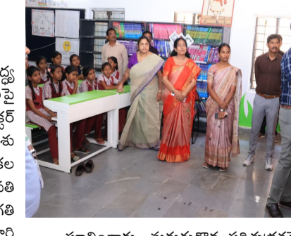
తెలుగు గళం న్యూస్ జనగామ, జూన్ 19