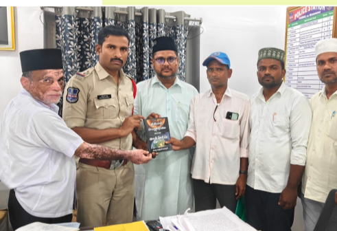
తెలుగు గళం న్యూస్ న్యూస్, తొర్రూరు, జూన్ 12