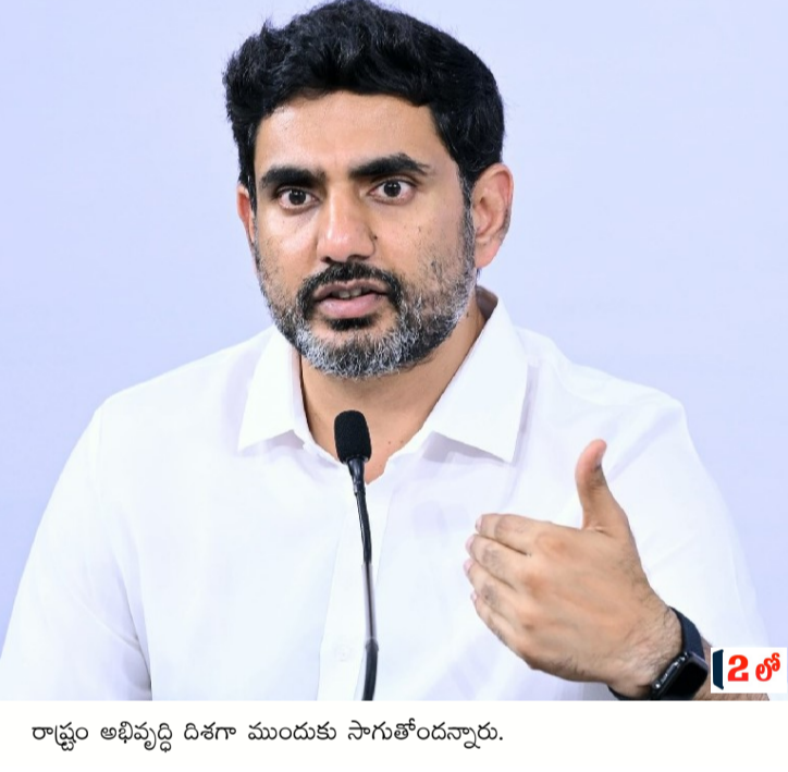
రాష్ట్రం అభివృద్ధి దిశగా ముందుకు సాగుతోందన్నారు.

న్యూస్ డెస్క్, 12 జూన్ (తెలుగు గళం): ఆంధ్రప్రదేశ్ లో ఎన్డీయే కూటమి ప్రభుత్వం రెండేళ్లు పూర్తి చేసుకున్న సందర్భంగా తిరుపతి జిల్లా దామినీడు వేదికగా శుక్రవారం భారీ బహిరంగ సభ నిర్వహించనున్నారు. ఈ సభకు ముఖ్యమంత్రి నారా చంద్రబాబు నాయుడు, ఉప ముఖ్యమంత్రి పవన్ కల్యాణ్, మంత్రి నారా లోకేష్ ముఖ్య అధిధులుగా హాజరయ్యారు. ఈ సందర్భంగా మంత్రి నారా లోకేష్ కీలక వ్యాఖ్యలు చేశారు. రప్పారప్పా అంటే తాము చూస్తూ ఊరుకోమని, రెడ్ బుక్ దాని పని అది చేసుకుంటూ పోతుందని ప్రతిపక్షంకు వార్నింగ్ ఇచ్చారు. జనసేన అధినేత, ఉప ముఖ్యమంత్రి పవన్ కల్యాణ్ పై మంత్రి నారా లోకేష్ ప్రశంసలు కురిపించారు. 'ఎక్కడ నెగ్గలో, ఎక్కడ తగ్గలో తెలిసిన వ్యక్తి పవన్ అన్న' అని పేర్కొన్నారు. తనకు సొంత అన్న లేని లోటును పవన్ అన్న తీర్చారన్నారు. రాష్ట్రంలో గత ప్రభుత్వంతో పోలిస్తే పరిస్థితులు పూర్తిగా మారిపోయాయన్నారు. 'ఇప్పుడు ఏపీలో భూతులు లేవు, జేసీబీలు లేవు. అక్రమాలు, దౌర్జన్యాలు కనిపించడం లేదు. ప్రజలకు రెండేళ్లుగా స్వాతంత్ర్యం లభించింది' అని పేర్కొన్నారు. గతంలో తాను చేపట్టిన పాదయాత్రలో దేవుడితో పెట్టుకోవద్దు అని చెప్పానని, ఆ మాటలను పట్టించుకోకుండా వ్యవహరించిన వారి పరిస్థితి ఇప్పుడు అందరికీ కనిపిస్తోందని మంత్రి నారా లోకేష్ ఎద్దేవా చేశారు. ముఖ్యమంత్రి చంద్రబాబు నాయుడిని భారత క్రికెట్ స్టార్ విరాట్ కోహ్లాతో పోల్చిన లోకేష్.. ఆయన నాయకత్వంలో