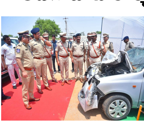
తెలుగు గళం న్యూస్ వరంగల్, జూన్ 11