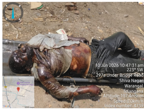
తెలుగు గళం న్యూస్ వరంగల్, జూన్ 11

వరంగల్ నగరంలోని అండర్ బ్రిడ్జి సమీపంలో గుర్తు తెలియని ఓ పురుషుని మృతదేహం లభ్యమైనట్లు ఇంతజ్వరంజ్ పోలీసులు తెలిపారు. మృతుడి చదువు సుమారు 35 నుంచి 45 సంవత్సరాల మధ్య ఉండవచ్చని పోలీసులు అంచనా వేస్తున్నారు. మృతుడి ఎత్తు సుమారు 5.5 అడుగులు ఉండగా, నల్ల చెక్య్/గ్రీడ్స్ ఉన్న తెలుపు రంగు షర్ట్ మరియు తెలుపు గీతలతో కూడిన నీలం రంగు లోయర్ ధరించి ఉన్నట్లు గుర్తించారు. మృతుడి గుర్తింపు కోసం పోలీసులు ప్రజల సహకారం కోరుతున్నారు. ఎవరైనా మృతుడిని గుర్తించగలిగితే వెంటనే ఇంతజ్వరంజ్ పోలీస్ స్టేషన్ ఫోన్ నెంబర్ 8712685007, 8712552342 లను సంప్రదించాలని విజ్ఞప్తి చేశారు.