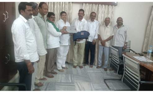
పర్యవేక్షి, జూన్ 11 (తెలుగు గళం):

చదువు సమాజంలో గౌరవం ఇస్తుంది' మాజీ ఖాదీ డైరెక్టర్ ఈగ మల్లేశం