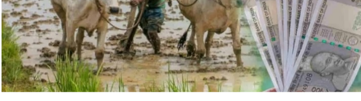
తెలుగు గళం న్యూస్ పర్వతగిరి/జూన్ 11

పంట బీమాతో రూ.38 వేల పరిహారం ప్రకృతి వైపరీత్యాలతో పంట నష్టపోతే 15 రోజుల్లోనే క్లెయిమ్ - పీఎం ఫసల్ బీమా యోజన