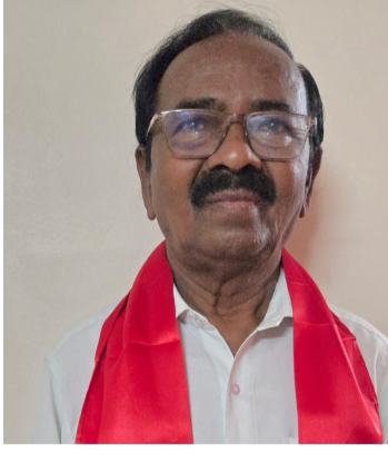
తెలుగు గళం న్యూస్, పర్యవేక్షి / జూన్ 11 :

కేంద్ర ప్రభుత్వ పైరావ్ల ముఖ్యమంత్రి ఒత్తిడి తేవాలి 200 రోజులు పనులు కలిగించాలి. రోజు కూలీ రూ.700 ఇవ్వాలి బి కె యం యు జాతీయ కార్యవర్గ సభ్యుడు వెంకట్రాములు