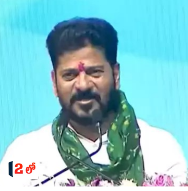
17న మరో లక్ష గృహప్రవేశాలు చేసాం. కొత్తగా మరో రెండున్నర లక్షల ఇందిరమ్మ ఇళ్లను ఈ వేదిక నుంచే మంజూరు చేస్తున్నట్లు ప్రకటిస్తున్నా.

కాగజేనగర్, తెలుగు గళం: ఆదిలాబాద్ ప్రాంత అభివృద్ధి కోసం నిరంతరం కృషి చేస్తానని తెలంగాణ సీఎం రేవంత్ రెడ్డి చెప్పారు. ఆదిలాబాద్ ఆదివాసీల సొంతింటి కల నెరవేరాలని ప్రతి నియోజకవర్గానికి 3,500 ఇళ్ల వాపున పేదలకు మంజూరు చేయాలని నిర్ణయం తీసుకున్నామని చెప్పారు. కాగజేనగర్లో వర్తమానం చేసిన సీఎం.. పలు అభివృద్ధి పనులను ప్రారంభించారు. అనంతరం బహిరంగ సభలో మాట్లాడారు. "తండాలు, గూడేల్లో ఉండే అర్హులైన ఆదివాసీ బిడ్డల కోసం స్పెషల్ డ్రైవ్ నిర్వహించి నూరు శాతం ఇందిరమ్మ ఇళ్లు ఇవ్వాలి. గుడిసెలు తీసి ఆదిలాబాద్ జిల్లాను నేను చూడాలనుకుంటున్నా. రాష్ట్రంలో సెప్టెంబర్ ప్రకటిస్తున్నా.