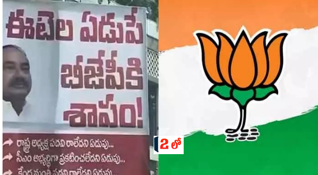
రాష్ట్ర అధ్యక్ష సీనియర్ కార్యకర్తలను... సీనియర్ అధ్యక్షుడిగా ప్రకటించలేదని ఏడుపు... కేంద్ర నాయకత్వం పరిష్కరించేలా చూడాలని కేడర్ కోరుతోంది.

న్యూస్ డెస్క్, 01 జూన్ (తెలుగు గళం): బీజేపీలో అంతర్గత పోరు నానాటికీ ముదురుతోంది. అధిపత్య పోరులో ఒకరిపై మరొకరు పైయే సాధించేందుకు కొందరు నేతలు తీవ్ర ప్రయత్నాలు చేస్తున్నారు. ఈ క్రమంలోనే పార్టీ పరువు, ప్రతిష్ఠను రోడ్డుకు ఈడుస్తున్నారనే విమర్శలు వినిపిస్తున్నాయి. ప్రత్యర్థులను అణిచివేయడమే లక్ష్యంగా దుష్ప్రచారం చేస్తున్నారని టాక్ వినిపిస్తోంది. క్రమశిక్షణకు మారుపేరుగా ఉండే బీజేపీ పార్టీ ట్యాగ్ లైన్ కు వ్యతిరేకంగా వ్యవహరిస్తున్నారనే విమర్శలు వ్యక్తమవుతున్నాయి. కీలకనేతల మధ్య జరుగుతున్న అధిపత్య పోరు కారణంగా కేడర్ తీవ్ర ఆందోళనకు గురవుతోంది. ఇప్పుడిప్పుడే రాష్ట్రంలో పార్టీకి మైలేజ్ వస్తున్న క్రమంలో నేతల తీరు వలన నష్టం జరుగుతోందని ఆవేదన వ్యక్తం చేస్తున్నారు. కేంద్ర నాయకత్వం ఇక్కడి పరిస్థితిపై దృష్టి సారించి సమస్యను పరిష్కరించేలా చూడాలని కేడర్ కోరుతోంది. ఈటల రాజేందర్ టార్గెట్.. బీజేపీలో గత కొంతకాలంగా పాత, కొత్త వివాదం రాజుకుంది. పార్టీలోని కొందరు తాజాగా ఎంపీ ఈటల రాజేందర్ లక్ష్యంగా తీవ్ర ఆరోపణలు, విమర్శలు చేస్తూ పోస్టర్లు వేశారు. ఇది కేంద్రమంత్రి బండి సంజయ్ వహానికి చెందిన కొందరి పని అంటూ ఈటల అనుచరులు ఆరోపిస్తున్నారు. నిజామాబాద్? ఎంపీ అర్పింద్, ఈటల కొంతకాలంగా సాన్నిహిత్యంగా ఉంటున్నారని.. దీంతో వారిని లక్ష్యంగా చేసుకొని వారిమధ్య గ్యాప్ వచ్చేలా పోస్టర్లు ముద్రించారని ఈటల అనుచరులు ఆరోపిస్తున్నారు. అయితే, బండి సంజయ్ కొడుకు భగీరథ్ మీద పోక్సా కేసు కావడంతో కేంద్రమంత్రి, ఈటల, అర్పింద్ మధ్య వివాదం మరింత ముదిరిందిని పార్టీ నాయకులు చెబుతున్నారు. బండి రాష్ట్ర అధ్యక్షుడిగా దిగిపోవడానికి మరోక్షణం ఈటల, ఇతర నేతలు కారణమంటూ బండి అనుచరులు ఆరోపిస్తున్నారు.