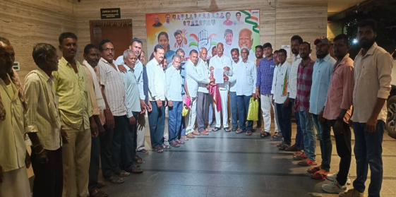
తెలుగు గళం న్యూస్ స్ట్రీఫెన్ ఘనపూర్ జూన్ 01

అందజేశారు. వీలైనంత తొందరలో పనులు పూర్తి చేయించి పాముసూరు గ్రామ రైతులకు రెండు పంటలకు సాగు నీరు అందిస్తానని హామీ ఇచ్చారు.