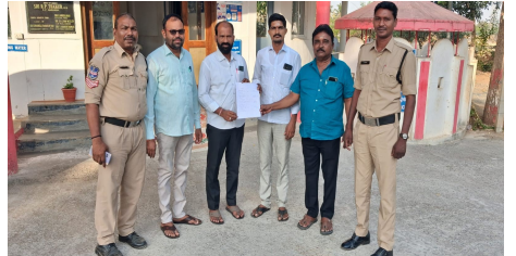
తెలుగు గళం న్యూస్ పర్వతగిరి/జూన్ 1

పర్వతగిరి, పెండింగ్ బిల్లులను వెంటది విడుదల చేయాలని డిమాండ్ చేస్తూ రాష్ట్ర మాజీ సర్పంచ్ల జేవీసీ ఇచ్చిన పిలుపు మేరకు సోమవారం హైదరాబాద్ లోని