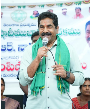
తెలుగు గళం న్యూస్ పర్వతగిరి/జూన్ 1

పర్వతగిరి, జూన్ 2న జరిగే తెలంగాణ రాష్ట్ర అవతరణ దినోత్సవ వేడుకలను ఘనంగా, విజయవంతంగా నిర్వహించాలని పర్వతగిరి ఎమ్మెల్యే కేఆర్ నాగరాజు పిలుపునిచ్చారు.