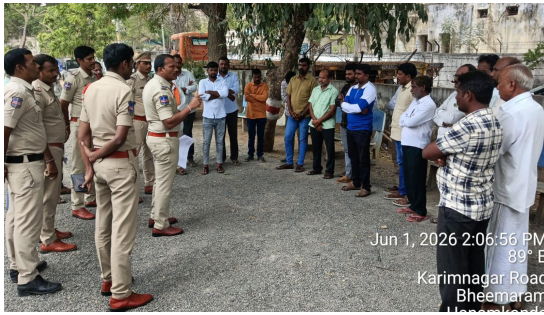
తెలుగు గళం న్యూస్ హస్తకొండ జూన్ 01

సమాజంలో శాంతిభద్రతలను కాపాడటంతో పాటు, రోడ్డుపక్క ప్రాంతాల్లో మార్పు తీసుకురావడమే లక్ష్యంగా హస్తకొండ జిల్లా హస్తకొండ పోలీస్ స్టేషన్ లో రోడ్డుపక్కకు నవీకరణ ఒక విశేష కౌన్సిలింగ్ కార్యక్రమం నిర్వహించారు.