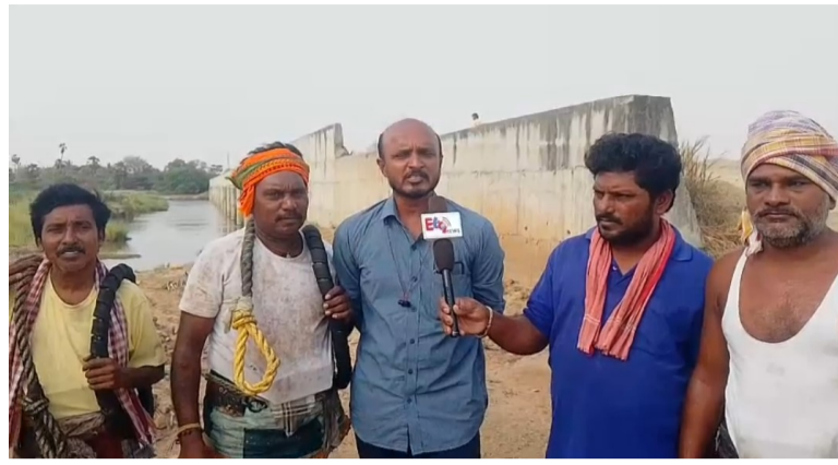
తెలుగు గళం న్యూస్ వర్తమానం మే 31

వరంగల్ జిల్లా వర్తమానం మండలం లేబర్ గ్రామం నుండి జగ్గా తండా వరకు అకేరు వాగుపై నిర్మిస్తున్న బ్రిడ్జి పనులు సత్తనడకన సాగుతున్నాయని గ్రామస్థులు ఆరోపిస్తున్నారు.