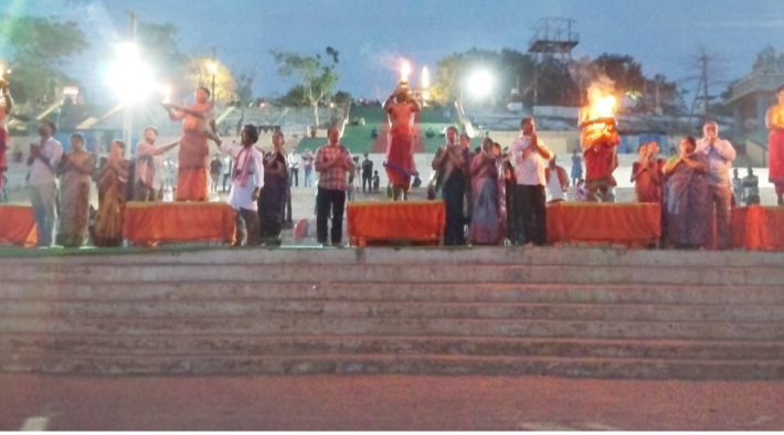
తెలుగు గళం న్యూస్ భద్రాద్రి కొత్తగూడెం జిల్లా, భద్రావలం