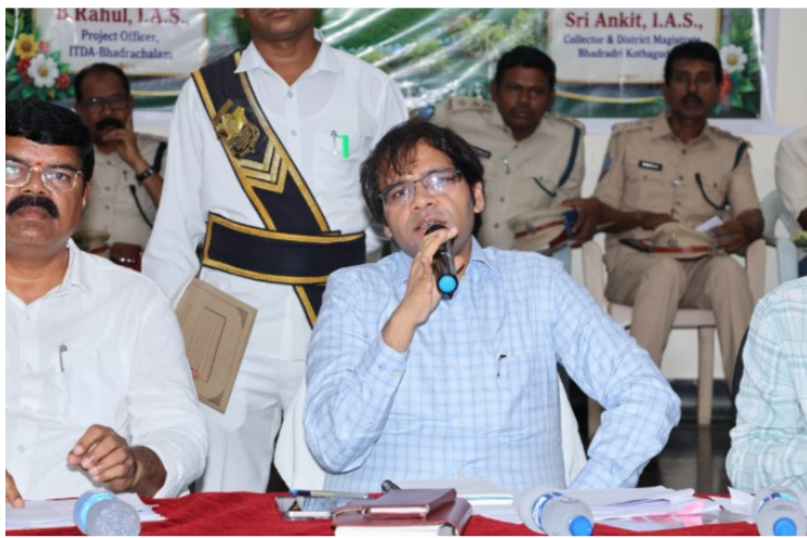
తెలుగు గళం న్యూస్ భద్రాచలం మే 27

గిరిజన ప్రాంతాల్లో మౌలిక సదుపాయాల కల్పనకు ప్రాధాన్యత ఇవ్వాలి