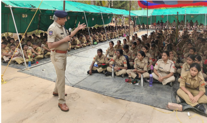
సత్పుష్పి, ఆర్.సి. మే 27 (తెలుగు గళం) న్యూస్: సైబర్ క్రిమీ అవగాహన కార్యక్రమంలో భాగంగా