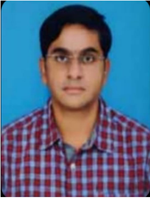
తెలుగు గళం న్యూస్, పర్యవేక్షకులు/మే 27

వరంగల్ జిల్లా పర్యవేక్షకులు మండలం వ్యవసాయ అధికారి మాట్లాడుతూ.. పంట కోత తర్వాత పొలంలో మిగిలిపోయిన వరి, గోధుమ లేదా మొక్కజొన్న గడ్డి వంటి పంట అవశేషాలను తగలబెట్టడాన్నే పంట వ్యర్థాలను కాల్చడం అంటారు. ఇది పొలాలను త్వరగా శుభ్రం చేయడానికి ఒక మార్గం అయినప్పటికీ, నేల ఆరోగ్యం మరియు పర్యావరణంపై దీనికి అనేక ప్రాతినిధ్యమైన ప్రభావాలు ఉన్నాయి. నేల ఆరోగ్యంపై ప్రధాన ప్రభావాలు 1. సేంద్రియ పదార్థం నష్టం కాల్చడం వల్ల పంట వ్యర్థాలలో ఉండే విలువైన సేంద్రియ కార్బన్ నశిస్తుంది. నేలలోని సేంద్రియ పదార్థం వీటికి అవసరం: నేల సారవంతం నీటి