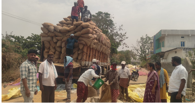
హమాబీ సంఘం నాయకులు తదితరులు పాల్గొన్నారు.