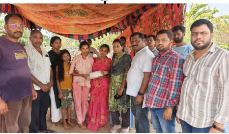
గ్రామ సర్పంచ్, గ్రామస్తులు తదితరులు పాల్గొన్నారు.