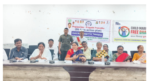
తెలుగు గళం న్యూస్ వర్షాగణి/మే 26