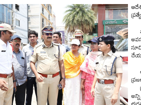
ట్రాఫిక్ పరిస్థితులను పరిశీలించిన ఆయన.. నిర్మాణ పనుల సమయంలో ప్రజలకు ఇబ్బందులు తలెత్తకుండా సమర్పనలను ట్రాఫిక్ మంత్రిత్వ శాఖల అనుమతితో చేయాలని ఆదేశించారు. ప్రత్యామ్నాయ రహదారుల అభివృద్ధిపై ప్రత్యేక దృష్టి పెట్టాలని సూచించారు. వాహనాల రాకపోకలు సాఫీగా సాగేందుకు అవసరమైన చర్యలు తీసుకోవాలని, కీలక ప్రాంతాల్లో సూచిత బోర్డులు, బ్యారీకేడ్లు, తగిన లైటింగ్ ఏర్పాటు చేయాలని అధికారులకు సూచించారు. అవసరమైన చోట్ల ట్రాఫిక్ సిబ్బందిని నియమించి ప్రజలకు ఇబ్బందులు లేకుండా చూడాలన్నారు. ట్రాఫిక్ పనుల నిర్వహణలో పూర్తి అయ్యేలా అన్ని శాఖలు సమన్వయంతో పనిచేయాలని, ప్రజల భద్రతకు అత్యంత ప్రాధాన్యత ఇవ్వాలని సీపీ రమేష్ పేర్కొన్నారు. ఈ కార్యక్రమంలో ట్రాఫిక్ డీసీపీ కేపాల్ రెడ్డి, ఏడీసీపీ హనుమంతరావు, సిఎంసీ ఇంజనీరింగ్ అధికారులు, ఇతర పోలీసు ఉన్నతాధికారులు పాల్గొన్నారు.

శేరిలింగంపల్లి, సైబరాబాద్ : (తెలుగు గళం) : ఐఐఐటీ కారిడార్ లో ట్రాఫిక్ సమస్యలకు శాశ్వత పరిష్కారం దిశగా చేపడుతున్న రహదారి అభివృద్ధి పనులను సైబరాబాద్ పోలీస్ కమిషనర్ డా. ఎం. రమేష్, ఐపీఎస్ మంగళవారం పరిశీలించారు. గచ్చిబౌలి ఐఐఐటీ జంక్షన్ వద్ద కొనసాగుతున్న మల్టీ లెవల్ ఫైట్ వర్క్, అందరేపాస్ నిర్మాణ పనుల పురోగతిపై అధికారులతో సమీక్ష నిర్వహించారు.