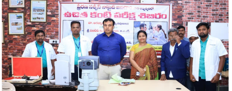
తెలుగు గళం న్యూస్ జనగామ, మే 23

ఉచిత కంటి వైద్య శిబిరంలో 170 మందికి పరీక్షలు