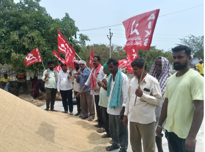
గడుపుతున్నారని, రైస్ మిల్లర్ల అక్రమాలపై మాత్రం చర్యలు తీసుకోవడం లేదని విమర్శించారు. సొంత వానానాల్లో ధాన్యం తరలిస్తున్న రైతులకు ట్రాన్స్పోర్ట్ చార్జీలు ఇవ్వకుండా

ప్రభుత్వాన్ని కోరారు. మార్కెట్ యార్డులో రైతులు తీవ్ర ఇబ్బందులు ఎదుర్కొంటున్నారని తెలిపారు. మద్దతు ధరకు ధాన్యం అమ్మేందుకు కొనుగోలు కేంద్రాలకు తీసుకొస్తే రోజుల తరబడి నిరీక్షించాల్సి వస్తోందని, గన్నీ బ్యాగుల కారణంతో పాటు హామాలీల సమస్యల కారణంగా కాంటాలు వేయడం లేదని రైతులు ఆవేదన వ్యక్తం చేస్తున్నారని చెప్పారు. కాంటాలు వేసిన తర్వాత కూడా ధాన్యాన్ని తరలించేందుకు లారీలు అందుబాటులో లేక రైతులు ఇబ్బందులు పడుతున్నారని తెలిపారు. మూడు నెలల కిందట ధాన్యం దిగుబడులపై వ్యవసాయ శాఖ మార్కెటింగ్ అధికారులకు నివేదిక ఇచ్చినా ముందున్న ప్రణాళిక లేకపోవడంతోనే ఈ పరిస్థితి ఏర్పడిందన్నారు. ఇప్పటికే 80 శాతం ధాన్యం కొనుగోలు చేశామని ప్రభుత్వం తప్పుడు ప్రకటనలు చేస్తోందని, ధాన్యం కొనుగోలు బాధ్యత నుంచి తప్పించుకునే ప్రయత్నం చేయడం సిగ్గుచేటని విమర్శించారు. జనగామ జిల్లా వ్యాప్తంగా ఐకేపీ ధాన్యం కొనుగోలు కేంద్రాల్లో కాంటాలు వేసిన ధాన్యం రైస్ మిల్లులకు చేరుకున్న తర్వాత "తరుగు", "మట్టి" పేర్లతో ఒక్కో 40 కిలోల బస్తాకు నాలుగు కిలోల వరకు కోత విధిస్తూ రైతులకు తీవ్ర నష్టం కలిగిస్తున్నారని ఆరోపించారు. ఆలోగే రైస్ మిల్లుల వద్ద బస్తాకు రూ. 30 చొప్పున హామాలీ ఖర్చులు వసూలు చేయడం దారుణమని విమర్శించారు. ఈ అక్రమాలపై జిల్లా కలెక్టర్ స్పందించి రైస్ మిల్లుల వద్ద జరుగుతున్న మోసాలపై క్రిమినల్ కేసులు నమోదు చేయాలని డిమాండ్ చేశారు. జిల్లా ప్రధాన కార్యదర్శి భూకావ్య చందు నాయక్ మాట్లాడుతూ జిల్లా కలెక్టర్ ఐకేపీ, పీసీఎస్ డిమాండ్ చేశారు. జిల్లా ప్రధాన కార్యదర్శి భూకావ్య చందు నాయక్ మాట్లాడుతూ జిల్లా కలెక్టర్ ఐకేపీ, పీసీఎస్ కొనుగోలు కేంద్రాలను మాత్రమే సందర్శిస్తూ కాలం