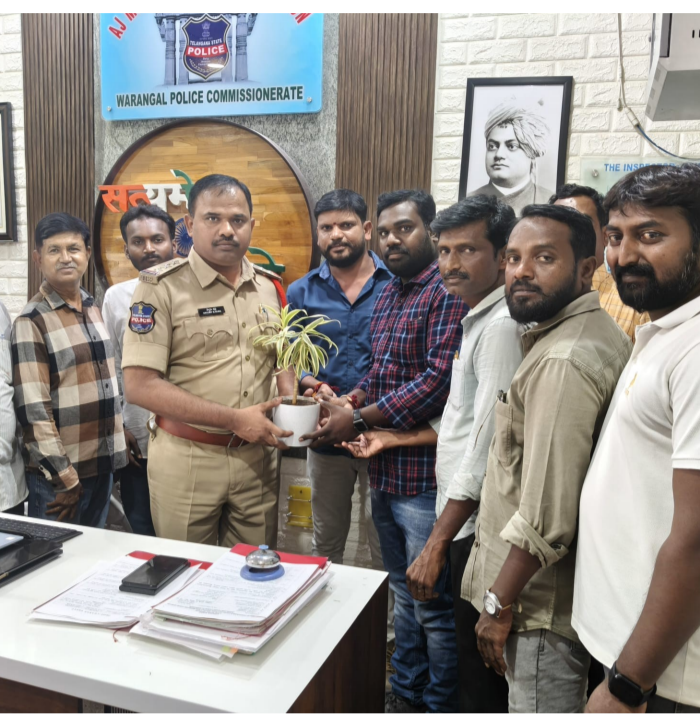
తెలుగు గళం న్యూస్ వరంగల్ మే 23

ప్రజల పక్షాన నిలిచి సేవలందించాలని ఆకాంక్ష