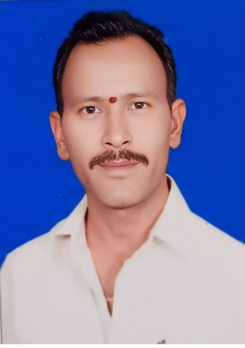
ఉద్యమాల చేతామని, ప్రజా సమస్యల పట్ల అధికారుల నిర్లక్ష్యం సహించబోమన్నారు.