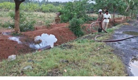
నక్కపల్లి, తెలుగు గళం మే 23: అనకాపల్లి జిల్లా నక్కపల్లి మండలం వేంపాడు టోల్ ప్లాజా వద్ద శనివారం తృతీయో భారీ ప్రమాదం తప్పింది. అచ్చుతాపురం సెజ్ నుంచి

పశ్చిమగోదావరి జిల్లా తాడిపత్రిగూడెం వైపు వెళ్తున్న అమ్మాయిని రవాణా వాహనం నుంచి గ్యాస్ లీకేజీ చోటుచేసుకోవడంతో టోల్ ప్లాజా సిబ్బంది అప్రమత్తమయ్యారు. వాహనం టోల్ ప్లాజా వద్దకు చేరుకున్న సమయంలో గ్యాస్ లీకేజీ వల్ల గుర్తించిన సిబ్బంది వెంటనే డ్రైవర్ ను హెచ్చరించారు. అనంతరం వాహనాన్ని టోల్ గేట్ కు కొద్ది దూరంలో రవాణా పక్కన నిలిపి వేయించారు. పరిస్థితి తీవ్రతను గుర్తించిన సిబ్బంది వెంటనే నక్కపల్లి పోలీసులకు, అగ్నిమాపక శాఖ అధికారులకు సమాచారం అందించారు. ఘటనాస్థలికి చేరుకున్న పోలీసులు, అగ్నిమాపక సిబ్బంది అప్రమత్త చర్యలు చేపట్టారు. నక్కపల్లి నుంచి తుని వైపు వెళ్లే వాహనాలను ప్రత్యామ్నాయ మార్గాల్లోకి మళ్లించి ప్రాంతీయ నియంత్రించారు. అమ్మాయిని గ్యాస్ ప్రభావం వాహనదారులు, స్థానికులకు తాకుకుండా జాగ్రత్తలు తీసుకున్నారు.