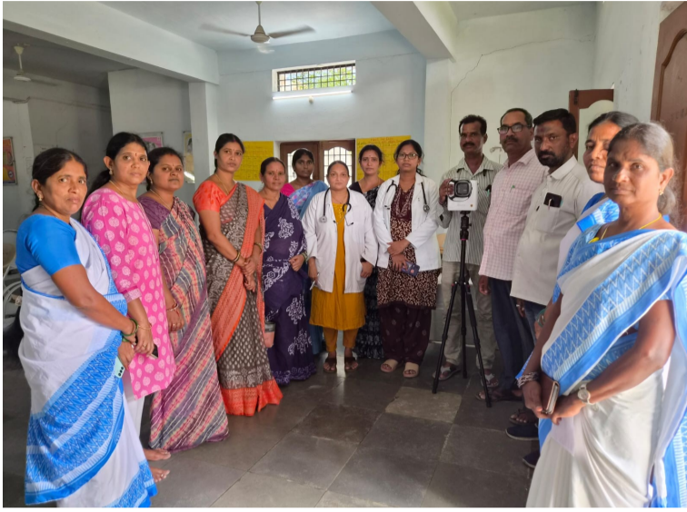
తెలుగు గళం న్యూస్ జనగామ మే 23