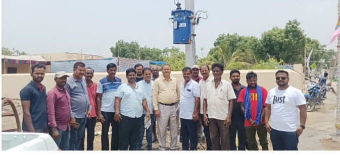
తెలుగు గళం న్యూస్ స్టేషన్ ఘనపూర్ మే20