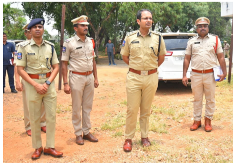
చెన్నారావుపేట, 20 మే (తెలుగు గళం): స్టేషన్