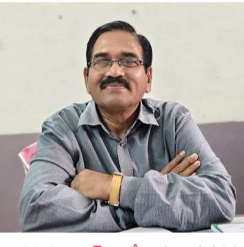
సత్తుపల్లి, ఆర్.సీ.మే20(తెలుగుగళం) న్యూస్: సత్తుపల్లి నుండి ఖమ్మం ప్రతిరోజు 3 స్టాప్ డీలక్స్ బస్సులు నడుపుతున్నట్లు