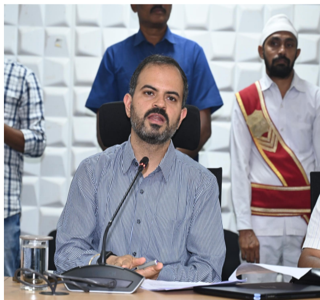
తెలుగు గళం న్యూస్ భూపాలపల్లి మహాదేవపూర్