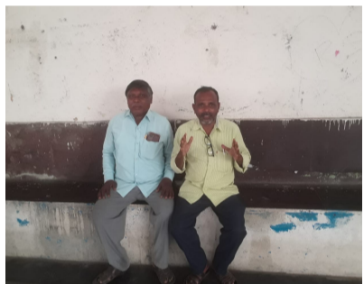
తెలుగు గళం న్యూస్ పర్వతగిరి/ మే20