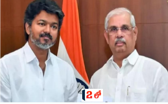
తెలుగు గళం : తమిళనాడు రాజకీయాల్లో అనూహ్య మలుపు చోటుచేసుకుంది. ప్రభుత్వ ఏర్పాటుకు సిద్ధమైన టీడీపీకి అధినేత విజయ్ కు గవర్నర్ రాజేంద్ర విశ్వనాథ్ ఆర్డర్ నుంచి ప్రతికూల స్పందన ఎదురైంది. రాజీనామాలో గవర్నర్ ను కలిసిన

విజయ్ కు, సంఖ్యాబలం విషయంలో సృష్టమైన నిబంధనలను గవర్నర్ గుర్తుచేశారు. తగినంత మెజారిటీ లేనిదే ప్రభుత్వం ఏర్పాటుకు అనుమతి ఇవ్వలేమని గవర్నర్ సృష్టం చేయడంతో తమిళనాడులో రాజకీయ సస్పెన్స్ మరింత ముదిరింది. ప్రభుత్వ ఏర్పాటుకు కావలసిన మ్యూజిక్ ఫిగర్ 118. అయితే ప్రస్తుత సమీకరణాల ప్రకారం టీడీపీకి బలం 108 సీట్లు (విజయ్ రెండు చోట్లా గెలవడంతో ఒక సీటుకు రాజీనామా చేయాలి) ఉంటుంది. కాబట్టి నికరంగా 107). మద్దతు ఇస్తున్న కాంగ్రెస్ బలం 5 సీట్లు. దీంతో మొత్తం బలం 112 అవుతుంది.