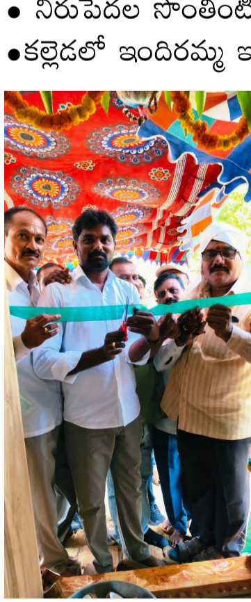
తెలుగు గళం న్యూస్ వర్కర్/మే 6