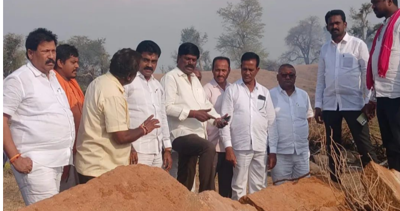
తెలుగు గళం న్యూస్ వర్కర్/మే 6

వరంగల్ జిల్లా నర్సంపేట నియోజకవర్గంలో ఖానాపురం మండలం అశోక్ నగర్ గ్రామంలో ఉన్న కాకతీయుల నాటి చారిత్రక శివాలయం రాత్రికి రాత్రి కూల్చివేత చేయటం జరిగింది. చారిత్రక ఆలయాన్ని విధ్వంసం చేసిన వారిపైన కఠినమైన చర్యలు తీసుకోవాలి ఆలయ కూల్చివేతపైన ప్రజలకు అనేక అనుమానాలు ఉన్నవి ప్రజల మనోభావాల దెబ్బతినేవిధంగా ఆలయ విధ్వంసం జరిగింది చరిత్రకాసులు మాత్రమే ఈ లాంటి పనులు చేస్తారు.