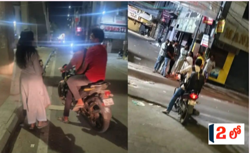
తెలుగు గళం న్యూస్ హైదరాబాద్ మే06