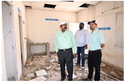
తెలుగు గళం న్యూస్ భూపాలపల్లి మహాదేవపూర్