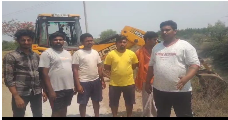
తెలుగు గళం న్యూస్ పర్వతగిరి/ఏప్రిల్ 30

- తుమ్మ చెట్టు తొలగించిన యువకులకు గ్రామస్థల ప్రశంసలు