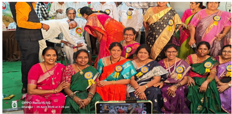
తెలుగు గళం న్యూస్ స్టేషన్ ఘనపూర్ ఏప్రిల్ 26

జనగామ జిల్లా స్టేషన్ ఘనపూర్ మున్సిపాలిటీ కేంద్రంలోని ఎస్ కన్వెన్షన్ హాల్లో జులై 1985-86 విద్యాసంవత్సరానికి చెందిన పదవ తరగతి పూర్వ విద్యార్థుల ఆత్మీయ సమ్మేళనం ఘనంగా జరిగింది. నాలుగు దశాబ్దాల తర్వాత ఒకే వేదికపై కలుసుకున్న పూర్వ విద్యార్థులు ఆనందంతో మురిసిపోయారు. కార్యక్రమం ప్రారంభంలో పరస్పరం ఆప్యాయంగా పలకరించుకుంటూ, ఒకరినొకరు గుర్తు పట్టుకుంటూ హార్మోనికానికి లోనయ్యారు. కొంతమంది స్నేహితులు చాలా కాలం తర్వాత కలవడంతో భావోద్వేగానికి గురయ్యారు. అనంతరం సమాహా ఘోటోలు తీసుకుంటూ ఆ క్షణాలను స్మృతులుగా నిలుపుకున్నారు. ఈ సందర్భంగా విద్యార్థులు తమ పాఠశాల దశలో గడిపిన మధుర జ్ఞాపకాలను గుర్తు చేసుకున్నారు. గురువుల బోధన విధానం, క్రమశిక్షణ, పాఠశాలలో జరిగిన వినోదాత్మక సంఘటనలు, క్రీడా పోటీలు, వార్షికోత్సవ వేడుకలను గుర్తు చేసుకుంటూ ఆ రోజులను మళ్లీ అనుభవించినట్లుగా భావించారు. కొందరు తమ ఉపాధ్యాయుల సేవలను స్మరించుకుంటూ కృతజ్ఞతలు తెలిపారు. అలాగే ప్రతి ఒక్కరు తమ జీవిత ప్రయాణం, వృత్తి, కుటుంబ పరిస్థితుల గురించి పరిచయం చేసుకుంటూ అనుభవాలను పంచుకున్నారు. వివిధ రంగాల్లో స్థిరపడిన తమ సహపాఠుల విజయాలను ఆహ్లదీనంగా గర్వంగా పేర్కొన్నారు. ఈ సమ్మేళనం స్నేహబంధాలను మరింత బలోపేతం చేయడంతో పాటు, భవిష్యత్తులో ఇలాంటి కార్యక్రమాలను తరచుగా నిర్వహించాలని నిర్ణయించారు. పాఠశాల అభివృద్ధికి సహకరించేందుకు కూడా కొందరు ముందుకు వచ్చారు. కార్యక్రమం ఆనందోత్సాహాల మధ్య స్నేహపూర్వక వాతావరణంలో విజయవంతంగా ముగిసింది.