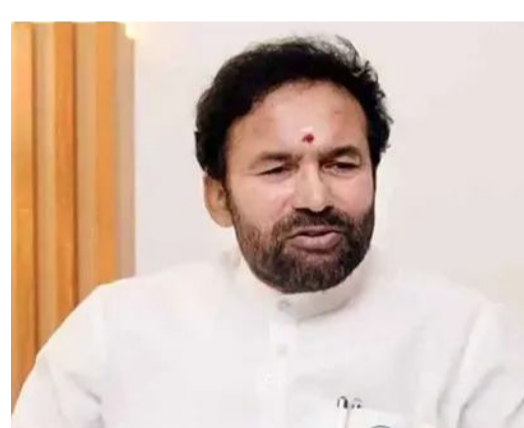
చేస్తుంది. ?వాలామంది తమ వివరాలు ఇన్న ప్రభుత్వ పథకాలు నిలిచిపోతాయేమో అని ఆందోళన చెందుతుంటారు. దీనిపై ప్రభుత్వం స్పష్టత ఇచ్చింది. ?మీరు ఇచ్చే వివరాలు వల్ల వ్యక్తిగతంగా ఎలాంటి ఇబ్బందులు కలగవు. ?జనాభా లెక్కల్లో

మంత్రి కిషన్ రెడ్డి హైదరాబాద్, ఏప్రిల్ 26: జనగణన స్వీయ సమూహం (సెల్ఫ్ ఎన్యుమరేషన్) చేసుకోవాలని తెలంగాణ ప్రజలకు కేంద్ర బౌద్ధి గమలు శాఖ మంత్రి కిషన్ రెడ్డి పిలుపునిచ్చారు. ఆదివారం హైదరాబాద్లో జనగణనలో భాగంగా దిల్ కుశ గెస్ట్ హౌస్లో అధికారుల సమక్షంలో మంత్రి కిషన్ రెడ్డి స్వీయ సమూహం చేసుకున్నారు. అనంతరం ఆయన మాట్లాడుతూ.. తెలంగాణ ప్రత్యేక రాష్ట్రం ఏర్పడిన తర్వాత జరుగుతున్న మొట్టమొదటి అధికారిక జనాభా గణన ఇది. రాష్ట్రాభివృద్ధి కోసం రూపొందించే ప్రణాళికలకు ఇది పునాది కానుంది. ప్రధానమంత్రి మోదీ అన్నట్లు "మందర్ అఫ్ డెమోక్రసీ"లో భాగస్వామ్యం కావడం అంటే, దేశ భవిష్యత్తును నిర్ణయించే ప్రక్రియలో ప్రతి పౌరుడు తన వంతు పాత్ర పోషించడమే. ప్రజలు తమ వివరాలను స్వయంగా సమూహం చేసుకునేందుకు మే 10వ తేదీ వరకు అవకాశం కల్పించడం గొప్ప సందేశమే. ఇది పారదర్శకతను పెంచడమే కాకుండా, సమయాన్ని ఆదా