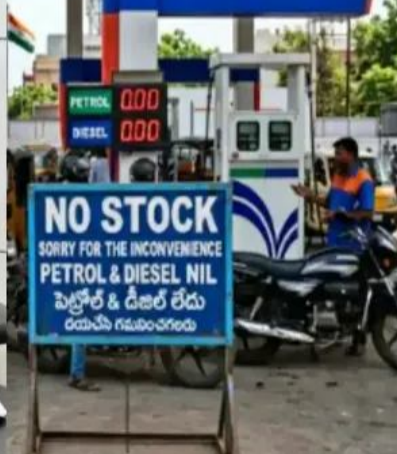
బంకుల పరిస్థితిపై నివేదిక ఇవ్వాలని కలెక్టర్లకు మంత్రి అచ్చెన్నాయుడు ఆదేశాలు జారీ చేశారు.

జరగకుండా చర్యలు తీసుకోవాలన్నారు. తెలారేసరికి ఎక్కడా నో స్టాక్ బోర్డులు కనిపించకూడదని సీఎం చంద్రబాబు ఆదేశాల్లో పేర్కొన్నారు. ప్రజలకు ఇబ్బంది కలకుండా క్రెడిట్ సమ సప్లయ తక్షణమే పరిష్కరించాలని ఆదేశాలు జారీ చేశారు. మరోవైపు పార్లమెంటు, శ్రీకా కుళం, కోనసీమ జిల్లా కలెక్టర్లతో మంత్రి అచ్చెన్నాయుడు తాజాగా టెలి కాన్ఫరెన్స్ పెట్టాల్, డీజిల్ సరఫరాపై మంత్రి అచ్చెన్నాయుడు సమీక్ష జరిపారు. ప్రజలకు ఎలాంటి అంతరాయం లేకుండా చర్యలు చేపట్టాలని అధికారులను ఆదేశించారు. ఈ మేరకు బంకుల్లో నిల్వలు, డిమాండ్ పరిస్థితిపై సమీక్షలో సమగ్రంగా చర్యలు జరిపారు.