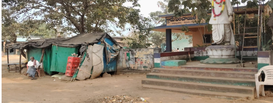
వేంసూరు, ఏప్రిల్ 26 (తెలుగు గళం) న్యూస్ మండల పరిధిలోని

రామన్నపాలెం గ్రామంలో బెట్ల షాపుల నియంత్రణపై ఎక్సైజ్ శాఖ నిరక్షం ప్రదర్శిస్తున్నదని గ్రామస్థులు ఆగ్రహం వ్యక్తం చేస్తున్నారు. గ్రామంలో సామాజిక శాంతి, ప్రజల ఆరోగ్యం, యువత భవిష్యత్తును దృష్టిలో ఉంచుకుని గుడులు, పాఠశాలలు, పంచాయతీ కార్యాలయం, చర్చిల సమీపంలో బెట్ల షాపులు నిర్వహించకూడదని గ్రామ పంచాయతీ ఏకగ్రీవంగా తీర్మానం చేసింది. కనీసం 100 మీటర్ల దూరంలోనే మద్యం విక్రయాలు జరగాలని నిర్ణయించి, ఆ తీర్మాన ప్రతిని ఎక్సైజ్ శాఖకు అందజేసింది. అయితే, ఇప్పటివరకు సంబంధిత శాఖ నుంచి ఎలాంటి చర్యలు తీసుకోవడం పట్ల గ్రామస్థులు అసంతృప్తి వ్యక్తం చేస్తున్నారు. పలు మార్లు ఫోన్ ద్వారా సంప్రదించడానికి ప్రయత్నించినప్పటికీ అధికారులు స్పందించకపోవడం, కార్డుకు స్పందించకపోవడం వంటి వ్యవహారం తీవ్ర విమర్శలకు దారితీసింది. ఈ నేపథ్యంలో పంచాయతీ తీర్మానాన్ని అమలు చేయించేందుకు, ఎక్సైజ్ శాఖ నిరక్షంపై ఉస్తాధికారులకు ఫిర్యాదు చేసేందుకు గ్రామ ప్రజలు సిద్ధమవుతున్నారు. అక్రమ మద్యం విక్రయాలను అరికట్టేందుకు అందరూ కలిసికట్టుగా ముందుకు రావాలని గ్రామస్థులు పిలుపునిచ్చారు.