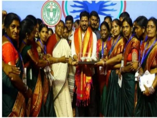
తీసుకుంటోంది. తాజాగా మహిళలను మరో భారీ కానుక ప్రకటించింది రేవంత్ సర్కార్. రాష్ట్రంలోని బీసీ మహిళలకు ప్రయోజనం చేకూరే విధంగా కీలక నిర్ణయం తీసుకుంది. నియోజకవర్గానికి 1000 మంది చొప్పున రాష్ట్రవ్యాప్తంగా

హైదరాబాద్ : రాష్ట్రంలోని మహిళలకు తెలంగాణ ప్రభుత్వం మరో గుడ్ న్యూస్ చెప్పింది. మహిళాసాధికారతే లక్ష్యంగా రాష్ట్ర ప్రభుత్వం మహిళల విషయంలో పలు కీలక నిర్ణయాలు తీసుకుంటోంది. ఇప్పటికే మహిళలకు అనేక పథకాలను అందించింది రేవంత్ సర్కార్. రాష్ట్రంలోని కోటి మంది మహిళలను కోటిశ్రమలను చేయడమే లక్ష్యంగా ముందుకెత్తోంది. ఈ క్రమంలో తాజాగా మరో కీలక ముందడుగు వేసింది కాంగ్రెస్ ప్రభుత్వం. తెలంగాణ రాష్ట్రంలోని బీసీ సామాజిక వర్గంలోని మహిళలకు అద్దెరిపోయే వార్షిక తెలిపింది. రాష్ట్రంలో బీసీ మహిళలకు 100 శాతం సబ్సిడీతో అటోమోటివ్ కుటుంబీకులను పంపిణీ చేయనున్నట్లు పేర్కొంది. ఈ మేరకు ప్రతీ నియోజకవర్గం నుంచి 1000 మందికి ఈ కుటుంబీకుల ప్రభుత్వం అందజేయనుంది. తెలంగాణ ప్రభుత్వం రాష్ట్రంలోని మహిళలకు గుడ్ న్యూస్ తెలిపింది. రాష్ట్రంలోని మహిళల కోసం ఆరు గ్యారంటీల్లో అనేక పథకాలను ప్రకటించడంతో పాటుగా రాష్ట్రంలోని కోటి మంది మహిళలను కోటిశ్రమలను చేయడమే లక్ష్యంగా కాంగ్రెస్ ప్రభుత్వం పలు కీలక నిర్ణయాలు