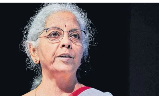
ముంబై: సెటితో పాటు దేశీయ ఆర్థిక సేవల రంగ నియంత్రణ

సంస్థలన్నీ సైబర్ భద్రత విషయంలో అత్యంత అప్రమత్తంగా ఉండాలని కేంద్ర ఆర్థిక మంత్రి నిర్మలా సీతారామన్ కోరారు. ఆమెరికాకు చెందిన కృత్రిమ మేధ (ఏఐ) కంపెనీ ఆండ్రోపిక్ అభివృద్ధి చేసిన అత్యధునిక ఏఐ మోడల్ 'క్లౌడ్ మిథోస్'పై ప్రపంచ ఆర్థిక రంగం లో ఆందోళనలు వ్యక్తమవుతున్న తరుణంలో మంత్రి ఈ వ్యాఖ్యలు చేయడం గమనార్హం. మిథోస్ పేరును ప్రస్తావించకుండానే, కొన్ని ఏఐ సాధనాలు సైబర్ దాడులను వేగవంతం చేశాయని, అనుకూలంగా మార్చాయని మంత్రి అన్నారు. గుర్తించడానికి సాధ్యం కాని ప్యూజిల్తో దాడి చేసే సామర్థ్యాలను అవి కలిగి ఉన్నాయన్నారు. దాడులకు ఉపయోగించే సాంకేతిక సాధనాలు వేగంగా పుణ్యకొస్తున్న