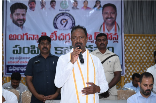
తెలుగు గళం న్యూస్ భూపాలపల్లి