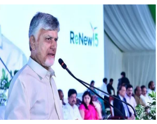
5:30 గంటల నుంచి 7:30 గంటల వరకు జరిగే ఈ అవార్డుల ప్రధానోత్సవంలో కేంద్ర ఆర్థిక మంత్రి నిర్మలా సీతారామన్ సహా

అమరావతి : ఏపీ ముఖ్యమంత్రి చంద్రబాబు నాయుడు పాలనా దక్షతకు మరో మకుటం దక్కింది. ప్రతిష్టాత్మక మీడియా సంస్థ ఎకసమిక్ టైమ్స్ ప్రకటించిన 'బిజినెస్ రిఫార్మర్ ఆఫ్ ది ఇయర్ 2025' అవార్డుకు ఆయన ఎంపికయ్యారు. రేపు (శనివారం) ముంబైలోని జియో వరల్డ్ కన్వెన్షన్ సెంటర్ లో జరిగిన భారీ కార్యక్రమంలో చంద్రబాబు ఈ పురస్కారాన్ని అందుకోనున్నారు. కేవలం 'ఈజ్ ఆఫ్ డూయింగ్ బిజినెస్' మాత్రమే కాదు, అంతకు మించి 'స్పీడ్ ఆఫ్ డూయింగ్ బిజినెస్', 'స్పీడ్ ఆఫ్ గవర్నెన్స్' అనే కొత్త నివాసాధారిత చంద్రబాబు పాలనలో దూసుకుపోతున్నారు. కూటమి ప్రభుత్వం అధికారంలోకి వచ్చిన అతి తక్కువ కాలంలోనే దాదాపు రూ. 20 లక్షల కోట్ల పెట్టుబడులను ఆకర్షించడంలో ఆయన సక్సెస్ అయ్యారు. ఐటీ, ఎలక్ట్రానిక్స్, గ్రీన్ ఎనర్జీ వంటి రంగాల్లో ఏపీని గ్లోబల్ హాట్ మార్కెట్ గా మార్చేందుకు ఆయన చేస్తున్న కృషిని ఎకసమిక్ టైమ్స్ జ్యూరీ ప్రత్యేకంగా ప్రశంసించింది. దిగ్గజాల సమక్షంలో పురస్కారం చేసే సాయంత్రం