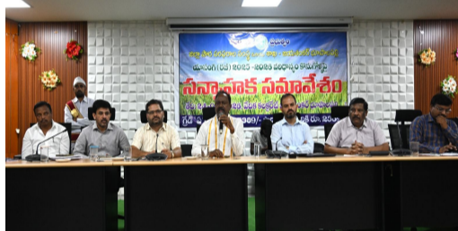
తెలుగు గళం న్యూస్ భూపాలపల్లి