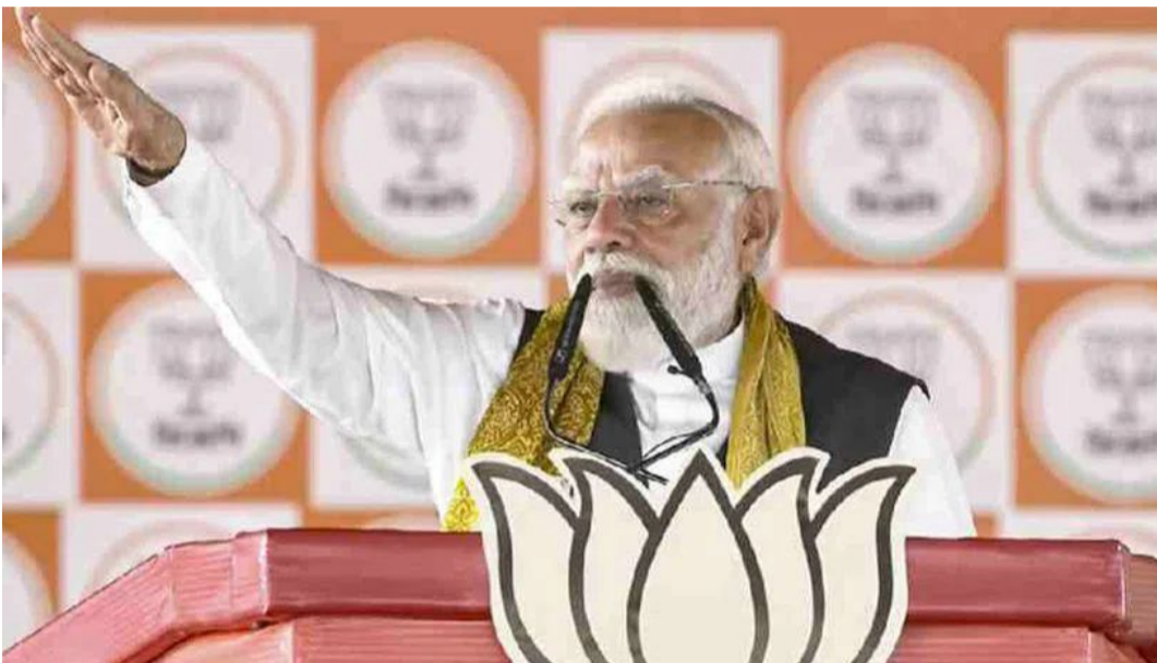
బెంగాల్ ఆడబిడ్డలు అత్యాచారానికి గురై న్యాయం కావాలని చెబుతోంది. మహిళలు కలలు కనడాన్ని టీఎంసీ అంగీకరింపలేదు. ఆడబిడ్డలు బయటకు రాకూడదని టీఎంసీ ప్రభుత్వం కఠినంగా అని వ్యాఖ్యానించారు.

పశ్చిమ బెంగాల్: పశ్చిమ బెంగాల్ లో నమోదైన భారీ పోలింగ్.. రాష్ట్రంలో మమత ఆధ్వర్యంలోని టీఎంసీ జంగిల్ రాజ్ పాలనకు అంతం అని ప్రధాని మోదీ వ్యాఖ్యానించారు. బెంగాల్ లోని దుమ్ దుమ్లో శుక్రవారం జరిగిన బీజేపీ ప్రచార సభలో మోదీ పాల్గొన్నారు. ఈ సందర్భంగా అక్కడి టీఎంసీ ప్రభుత్వంపై కీలక వ్యాఖ్యలు చేశారు. పశ్చిమ బెంగాల్ లో గురువారం జరిగిన తొలి దశ ఓటింగ్ లో భారీ స్థాయిలో పోలింగ్ నమోదైన సంగతి తెలిసిందే. ఈ అంశంపై కూడా మోదీ మాట్లాడారు. "తొలి దశ ఎన్నికల్లో రికార్డ్ స్థాయిలో పోలింగ్ నమోదైందంటే అది టీఎంసీ మహా జంగిల్ రాజ్ ప్రభుత్వానికి అంతం మొదలైందే. రాష్ట్రంలో బీజేపీ కచ్చితంగా అధికారంలోకి వస్తుంది. బీజేపీకి అందగా నిలుస్తున్న మహిళా ఓటర్లకు ధన్యవాదాలు. గురువారం నాడు బీజేపీకి లభించిన మద్దతు పార్టీ విజయ శంఖారావం పూరించినట్లే. బెంగాల్ లో ఎక్కడ ప్రజాస్వామ్యాన్ని తన నిరంకుశత్వంతో టీఎంసీ అంతం చేసిందో, అక్కడే, మొదటి దశలోనే ప్రజలు ప్రజాస్వామ్య దేవాలయాన్ని నిర్మించడం ప్రారంభించారు. బీజేపీ అధికారంలోకి రాగానే ఆయుష్మాన్ భారత్ యోజన పథకాన్ని వర్ధిల్లజేస్తాం. అర్హులైన వారికి బడు లక్షల వైద్యం అందిస్తాం. ప్రభుత్వం ఏర్పడ్డ తొలి క్యాబినెట్ మీటింగ్ లోనే దీనిపై నిర్ణయం తీసుకుంటాం. టీఎంసీ మహిళా వ్యతిరేక పార్టీ. మహిళలు అభివృద్ధి చెందాలని టీఎంసీ కోరుకోవడం లేదు. మహిళల భద్రత బీజేపీ మొదటి ప్రాధాన్యం.