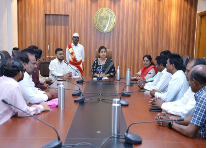
కార్డులు జారీ చేయాలని సూచించారు. పుష్టి ప్రమాణాలు, అనుభవం, సంస్థ గుర్తింపు వంటి అంశాలను ప్రామాణికంగా