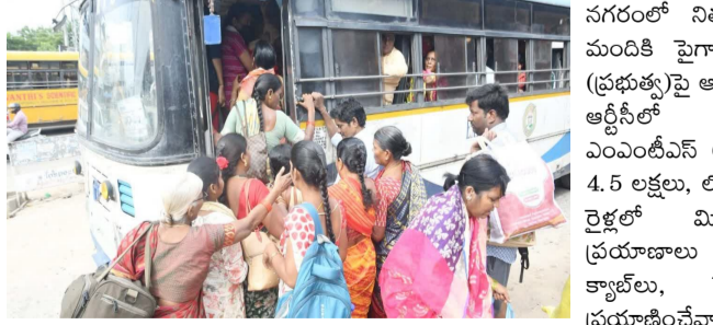
లో ఎంఎంఎస్ సర్వీసులతో నగరంలో నిత్యం 30 లక్షల మందికి పైగా ప్రజా రవాణా (ప్రభుత్వ) ఆధారపడి ఉండగా ఆర్టీసీలో 26 లక్షలు, ఎంఎంఎస్ 60 వేలు, మెట్రో 4.5 లక్షలు, లోకల్, ప్యాసిజర్ రైల్వేలో మిగిలిన వారు ప్రయాణాలు చేస్తున్నారు. క్యాబ్లు, షేర్ ఆటోల్లో ప్రయాణించేవారు మళ్లీ దీనికి అదనం. సమ్మె వల్ల బస్సులు పరిమితంగా నడుపుతుండటంతో మిగిలిన విభాగాల్లో సర్వీసులను పెంచాలి అవసరం అని యాజమాన్యం ఏర్పడింది. వగ ఉంటుంది. ఈ సమయంలో నగరంలో, శివారు ప్రాంతాల నుంచి ఎక్కువ బస్సులు నడపాలి ఉంటుంది. ఆర్టీసీలకు వెళ్లేవారు, విద్యార్థులు, రోజువారీ కార్డులకు సమయం వినియోగించాలని ఆర్టీసీ పలు ఆలోచనలు చేస్తోంది. 30 లక్షల మందికి పైగా ప్రజారవాణాపై : హైదరాబాద్? మహానగరం

ఆర్టీసీ కార్డులకు సమ్మెకు పిలుపునిచ్చిన నేపథ్యంలో యాజమాన్యం ప్రత్యామ్నాయ ఏర్పాట్లపై దృష్టి పెట్టింది. ప్రయాణికులకు ఎలాంటి అసౌకర్యం కలగకుండా 1000 బస్సులను అద్దె, ఔట్ సోర్సింగ్ విధానంలో నడపడానికి నిర్ణయం చేసింది. మంగళవారం అర్ధరాత్రి నుంచి కార్డులు లేని సమ్మె చేస్తామని పిలుపునిచ్చిన నేపథ్యంలో బుధవారం 480 ఎలక్ట్రిక్ బస్సులను, 250 అద్దె బస్సులు, మరో 270 ఇతర బస్సులను పొరుగు సేవల పద్ధతిలో నడపనున్నట్లు ఆర్టీసీలోని ఓ కీలక ఉన్నతాధికారి తెలిపారు. కనీసం 2వేల బస్సులు అవసరం : గ్రేటర్ హైదరాబాద్ మున్సిపల్ కార్పొరేషన్లో నిత్యం 3000 బస్సుల్లో సుమారు 26 లక్షల మంది ప్రయాణం చేస్తున్నారు. 1000 బస్సులతో నెట్టూరాణం ఇదే గ్రేటర్ ఆర్టీసీకి ఇప్పుడు పెద్ద సవాల్ గా మారింది. ప్రయాణికుల అవసరాల మేరకు కనీసం 2 వేల బస్సులైన ఔటర్ రింగ్ రోడ్డు పరిధిలో నడపాలి. 1000 బస్సులతో ప్రాంతీయ సంఖ్య పెంచినా డిమాండ్ కు తగినన్ని సర్వీసులు సర్దుబాటు చేయడంలో పలు ఇబ్బందులు తలెత్త