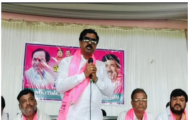
తెలుగు గళం న్యూస్ స్టేషన్ ఘనపూర్ ఏప్రిల్ 15

జనగామ జిల్లా చిల్డ్రన్ మండలం వరలక్ష్మి ఫంక్షన్ హాల్లో జరిగిన ముఖ్య కార్యకర్తల సమావేశంలో తెలంగాణ తొలి ఉప ముఖ్యమంత్రి డాక్టర్ టి. రాజయ్య సంచలన వ్యాఖ్యలు చేశారు. ఈ సందర్భంగా ఆయన మాట్లాడుతూ..నియోజకవర్గంలోని కార్యకర్తలందరిని కాపాడుకోవడం తన బాధ్యత అని స్పష్టం చేశారు. తాను ఉన్నంతవరకు తనను వక్రం పెట్టి ఈ నియోజకవర్గంలో ఎవరూ అడుగుపెట్టలేరని హెచ్చరించారు. స్టేషన్ ఘనపూర్ పై చాలామంది కన్నేశారని, అయితే నిజమైన పట్టుదల తనదేనని పేర్కొన్నారు. అభివృద్ధి విషయంలో స్టేషన్ ఘనపూర్ రాష్ట్రంలో నాలుగో స్థానంలో నిలిచిందని తెలిపారు. "చిల్డ్రన్ మాటలు మాట్లాడొద్దు, రాజయ్యను కాదని ఎవరూ ముందుకు రారు" అంటూ కార్యకర్తలకు ధైర్యం ఇచ్చారు. తాను స్టార్ క్యాంపెయినింగ్ గా పనిచేసినప్పుడు జనంగా, స్టేషన్ ఘనపూర్ నియోజకవర్గాల్లో పార్టీ విజయానికి కృషి చేశానని గుర్తు చేశారు. ఎవరూ ఆందోళన చెందవద్దని, అందరినీ కాపాడుకునే బాధ్యత తనదేనని తెలిపారు. తన రాజకీయ జీవితానికి పునాది వేసింది వై.ఎస్. రాజశేఖర్ రెడ్డి అని పేర్కొన్న ఆయన, కల్యాణకుంట్ల చంద్రశేఖర్ రావు ను దేవుడితో సమానంగా భావిస్తానని అన్నారు. పార్టీకి వ్యతిరేకంగా వ్యవహరించిన వారిపై క్రమశిక్షణ చర్యలు తీసుకుంటామని హెచ్చరించారు. అలాగే కడియం శ్రీహరి పై తీవ్ర వ్యాఖ్యలు చేస్తూ, పార్టీకి మోసం చేసిన వారిని ప్రజలు తగిన విధంగా గుణపాఠం చెప్పాలని పిలుపునిచ్చారు.