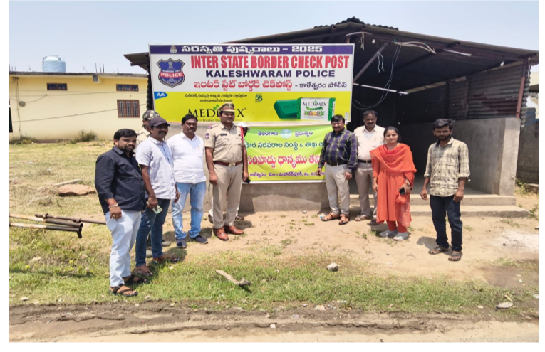
తెలుగు గళం న్యూస్ భూపాలపల్లి కాళేశ్వరం