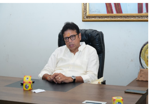
తెలుగు గళం న్యూస్ భూపాలపల్లి

- అధికారులకు మంత్రి శ్రీధర్ బాబు దిశానిర్దేశం