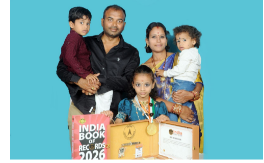
తెలుగు గళం న్యూస్ వార్షికోత్సవం // 15