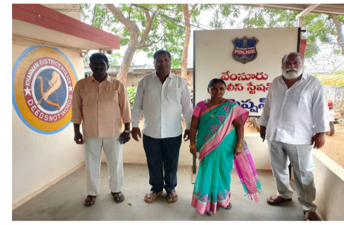
సత్తుపల్లి.ఆర్.సి.ఏప్రిల్ 15(తెలుగుగళం) న్యూస్:

సత్తుపల్లి నియోజకవర్గ పరిధిలోని వేంసూరు మండలశీల్లోని వెన్నచేరు వెంకటాపురం గ్రామంలో నిర్వహించిన సత్తుపల్లి సబ్ స్టేషన్ కు బుధవారం భూమి పూజ, శంకుస్థాపన చేయనున్నారు. అట్టి కార్యక్రమానికి ముఖ్య అతిథిగా రాష్ట్ర ఉప