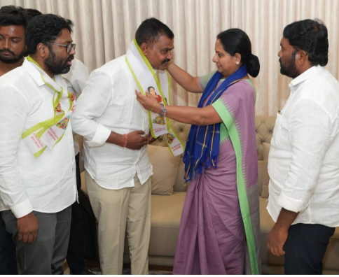
తెలుగు గళం న్యూస్ నర్సంపేట ఏప్రిల్ // 15

నర్సంపేట నియోజకవర్గం బిజెపి పార్టీ జిల్లా కౌన్సిల్ మెంబర్ నర్సంపేట మునిపాలిటి 29వ వార్డ్ కౌన్సిల్ అభ్యర్థిగా పోటీ