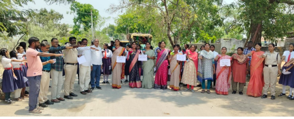
ధర్మసాగర్, (తెలుగు గళం) ఏప్రిల్ 15: