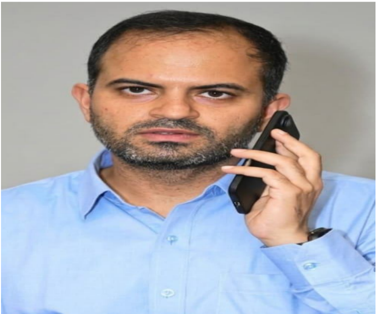
తెలుగు గళం న్యూస్ భూపాలపల్లి

ప్రజాపాలన -- ప్రగతి ప్రణాళిక 99 రోజుల కార్యక్రమంలో భాగంగా గురువారం జిల్లాలోని అన్ని మండలాల్లో మండల స్థాయి గ్రామసభలను సమర్థవంతంగా నిర్వహించాలని జిల్లా కలెక్టర్ రావలల్ శర్మ ఎంపిడివోలకు ఆదేశించారు. బుధవారం నిర్వహించిన టెలి కాన్ఫరెన్స్ లో గ్రామసభల నిర్వహణపై సమీక్షిస్తూ కలెక్టర్ మాట్లాడుతూ, ప్రభుత్వ ప్రాధాన్య పథకాలపై ప్రజలకు విస్తృత అవగాహన కల్పించడం, ప్రజల భాగస్వామ్యాన్ని పెంపొందించడం గ్రామసభల ప్రధాన లక్ష్యమని పేర్కొన్నారు. ప్రతి మండలంలో అన్ని శాఖల అధికారులు తప్పనిసరిగా పాల్గొని, ప్రగతి ప్రణాళిక లక్ష్యాలు, అమలు విధానం, లబ్ధిదారులకు కలిగే ప్రయోజనాలను స్పష్టంగా వివరించాలని సూచించారు. గ్రామసభల సందర్భంగా ప్రజల సమస్యలను గుర్తించి, వాటి పరిష్కారానికి తక్షణ చర్యలు చేపట్టాలని కలెక్టర్ ఆదేశించారు. కార్యక్రమాలు పారదర్శకంగా, సజావుగా జరిగేలా అధికారులు సమన్వయంతో పనిచేయాలని సూచించారు. వేసవి తీవ్రత దృష్ట్యా గ్రామసభలకు హాజరయ్యే ప్రజలకు తాగునీరు, నీడ వంటి మౌలిక సదుపాయాలు కల్పించాలని స్పష్టం చేశారు. గ్రామసభలకు ప్రజా ప్రతినిధులు, గ్రామ పెద్దలు, వివిధ వర్గాల ప్రజలను విస్తృతంగా ఆహ్వానించి, కార్యక్రమాన్ని విజయవంతం చేయాలని కలెక్టర్ పిలుపునిచ్చారు.