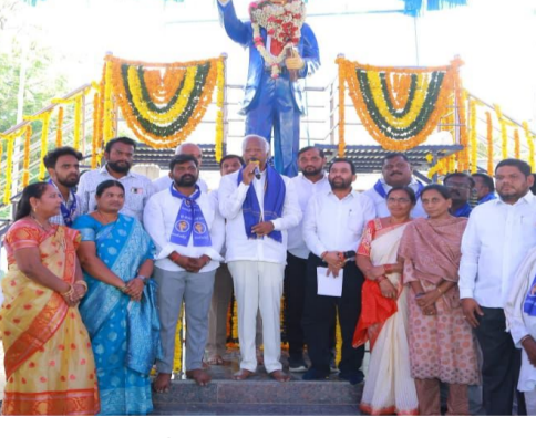
తెలుగు గళం న్యూస్ స్వీషన్ ఘనపూర్, ఏప్రిల్ 14