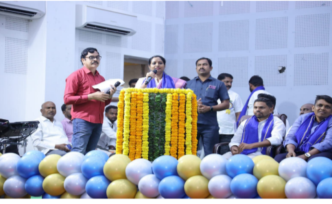
తెలుగు గళం న్యూస్ హైదరాబాద్, ఏప్రిల్ 14

- డాక్టర్ బి.ఆర్ అంబేద్కర్ 135వ జయంతి వేడుకల్లో పాల్గొన్న వరంగల్ ఎంపీ డాక్టర్ కడియం కావ్య - రాజ్యాంగం ద్వారా దేశ ప్రజలకు హక్కులు కల్పించిన మహనీయుడు డాక్టర్ బి.ఆర్ అంబేద్కర్