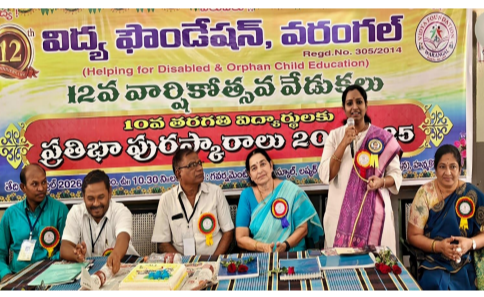
తెలుగు గళం న్యూస్ హైదరాబాద్, ఏప్రిల్ 14