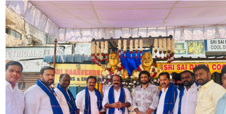
తెలుగు గళం న్యూస్ హైదరాబాద్, ఏప్రిల్ 14