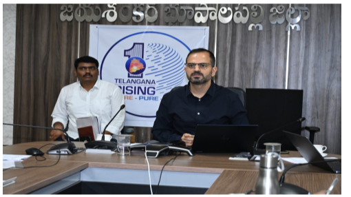
తెలుగు గళం న్యూస్ భూపాలపల్లి

771 ఎన్యూమరేటర్లు, 134 సూపర్వైజర్ల నియామకం సెల్స్ ఎన్యూమరేషన్ పై విస్తృత అవగాహన కార్యక్రమాలు