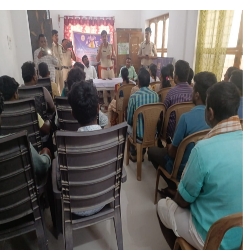
తెలుగు గళం న్యూస్ భూపాలపల్లి కొత్తపల్లి గోరి

జయశంకర్ భూపాలపల్లి జిల్లా కొత్తపల్లి గోరి మండల కేంద్రంలోని గ్రామ పంచాయతీ కార్యాలయంలో రోడ్డు భద్రతపై అవగాహన కార్యక్రమం ఘనంగా నిర్వహించబడింది. జిల్లా ఎస్పి సిరిశెట్టి సంకీర్ణ్ ఆదేశాల మేరకు, తెలంగాణ ప్రభుత్వం చేపట్టిన