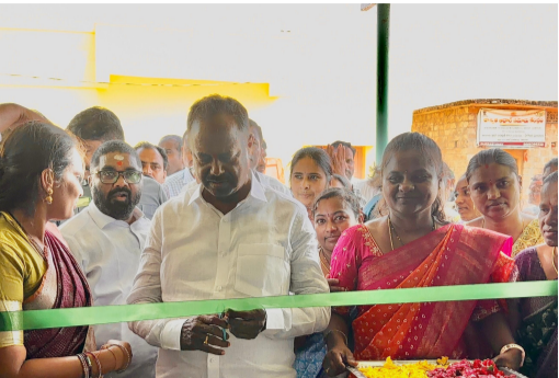
తెలుగు గళం న్యూస్ భూపాలపల్లి రేగోండ