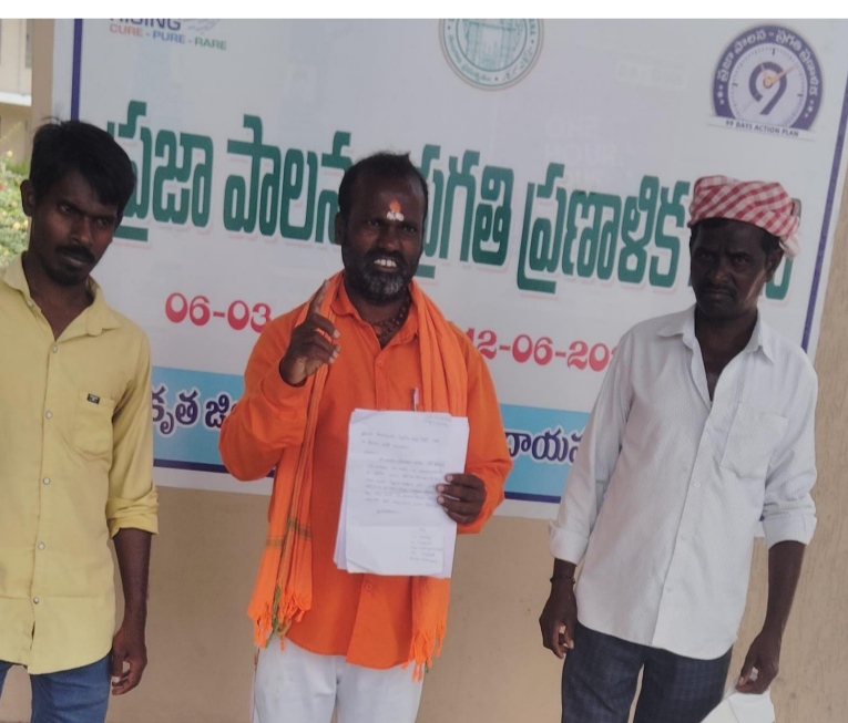
తెలుగు గళం న్యూస్ సిద్దిపేట