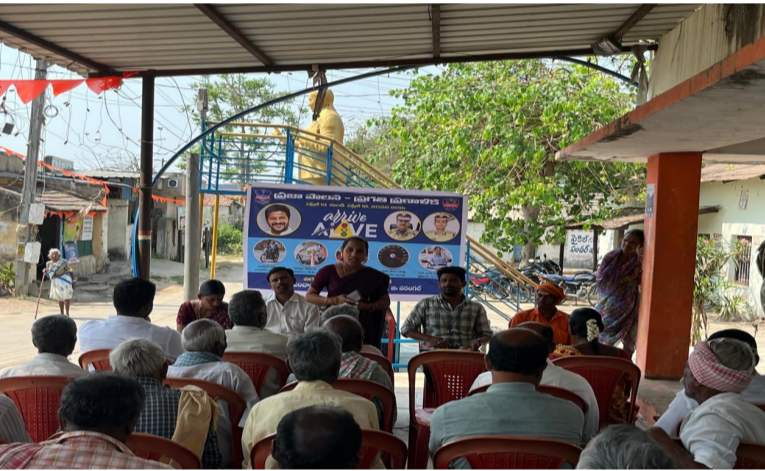
- రోడ్డు భద్రత ప్రతి ఒక్కరి బాధ్యత