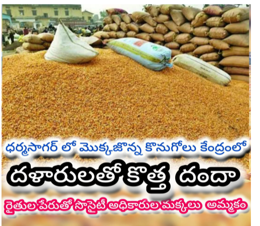
ధర్మసాగర్ లో మొక్కజొన్న కొనుగోలు కేంద్రంలో దళారులతో కొత్త దండా రైతులపేరుతో సాస్టెట్ అధికారుల మక్కులు అమ్మకం

- సాస్టెట్ అధికారులతో కుమ్మక్క అనే ఆరోపణలు