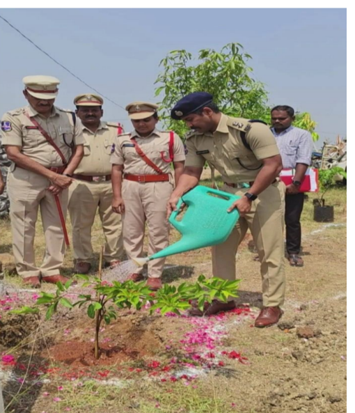
తెలుగు గళం న్యూస్ భూపాలపల్లి టేకుమట్ల

- పెండింగ్ కేసుల వేగవంత పరిష్కారం, ప్రజలకు సేవలందించాలంటూ ఆదేశాలు