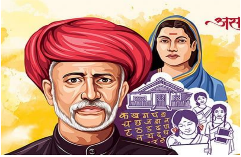
(తెలుగు గళం దినపత్రిక ప్రత్యేకం)

ప్రతి సంవత్సరం ఏప్రిల్ 11న మహాత్మా జ్యోతిరావు పూలే జయంతిని దేశవ్యాప్తంగా ఘనంగా నిర్వహించుకుంటారు. భారతదేశ సామాజిక చరిత్రలో అణగారిన వర్గాల అభ్యున్నతి కోసం, కుల వివక్ష నిర్మూలన కోసం అక్షర యుద్ధం చేసిన మహానీయుల్లో ఆయన స్థానం అపూర్వం. 1827 ఏప్రిల్ 11న మహారాష్ట్రలోని సతారా జిల్లాలో జన్మించిన పూలే, సమాజంలో నెలకొన్న అసమానతలను తొలగించి సమానత్వ సమాజాన్ని నిర్మించాలని జీవితాంతం కృషి చేశారు.