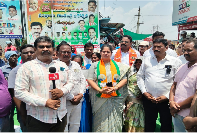
తెలుగు గళం న్యూస్ భూపాలపల్లి చెల్వూర్