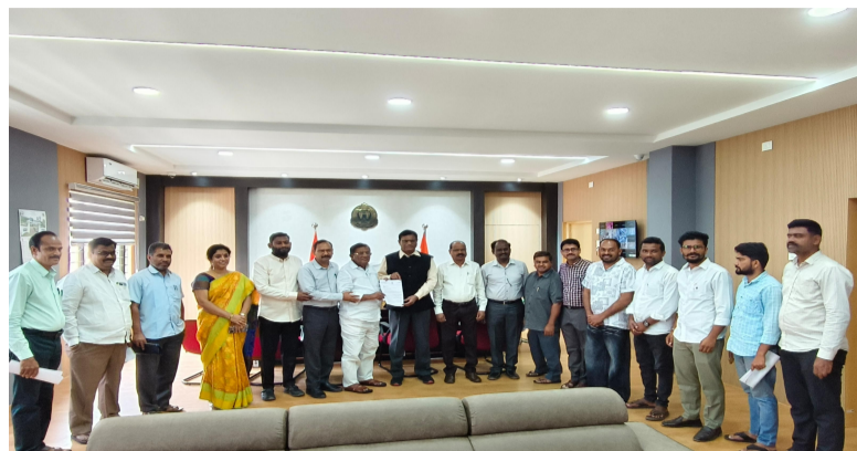
తెలుగు గళం న్యూస్ హానుమకొండ