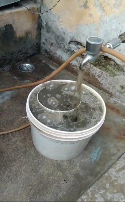
తెలుగు గళం న్యూస్ హైదరాబాద్, ఏప్రిల్ 8