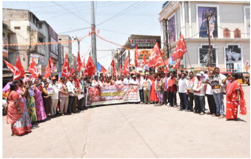
తెలుగు గళం న్యూస్ వరంగల్ ఏప్రిల్ 07

ఇరాన్ పై అమెరికా, ఇజ్రాయిల్ దేశాలు కొనసాగిస్తున్న యుద్ధాన్ని తక్షణమే ఆపాలని, ప్రపంచ శాంతిని కాపాడాలని వామపక్ష పార్టీలు, ప్రజా సంఘాల డిమాండ్ చేశాయి.