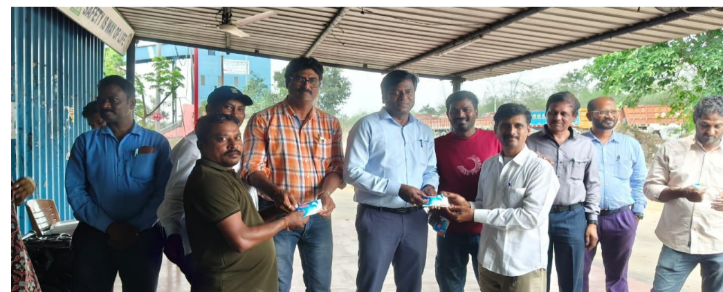
వేసవి కాలంలో కార్మికులు అధిక ఉష్ణోగ్రతల మధ్య కష్టపడి పనిచేస్తున్నారని, వారి ఆరోగ్యం కాపాడేందుకు తగిన చర్యలు తీసుకుంటున్నామని తెలిపారు. కార్మికులు తగిన జాగ్రత్తలు పాటిస్తూ ఆరోగ్యాన్ని సంరక్షించుకోవాలని సూచించారు. ఇదిలా ఉండగా కిష్టాశీ ఓపెన్ క్యాన్స్ ప్రాజెక్టులో సింగరేణి యాజమాన్యం తరపున ఇంటర్ ఏరియా ప్రభుత్వ చికిత్స పోలీసు నిర్వహించారు. ఈ పోలీసు ద్వారా అత్యవసర పరిస్థితుల్లో ప్రభుత్వ చికిత్స అందించే వైపుబాటను పెంపొందించడమే లక్ష్యమని పేర్కొన్నారు.