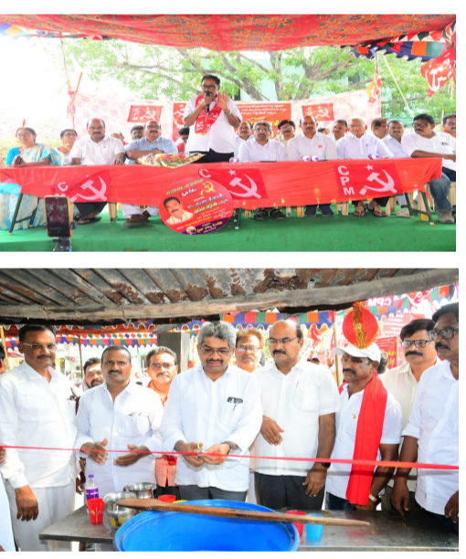
తెలుగు గళం న్యూస్, ఖమ్మం పట్టణం ఏప్రిల్ 07, ఖమ్మం జిల్లా :