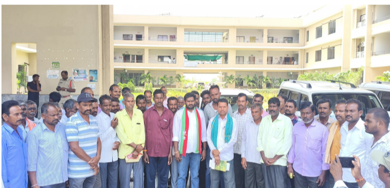
తెలుగు గళం న్యూస్ భూపాలపల్లి