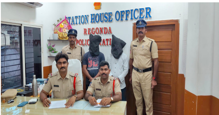
తెలుగు గళం న్యూస్ భూపాలపల్లి రేగౌండ్