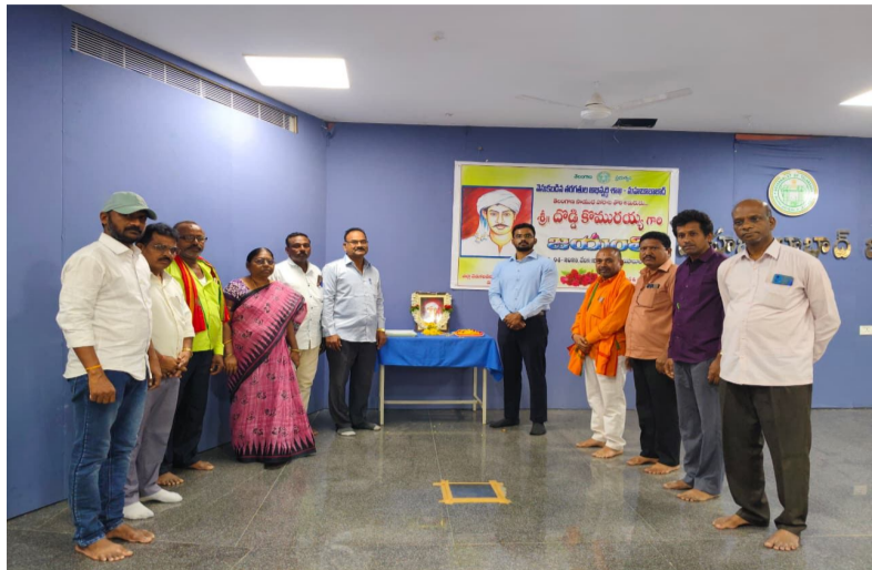
తెలుగు గళం స్ఫూర్తి మహిళాబాబా జిల్లా

- అదనపు కలెక్టర్ (స్థానిక సంస్థలు) లెనిన్ వత్సల్ టోపిక్స్.