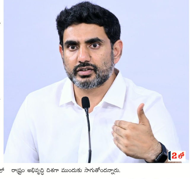
రాష్ట్రం అభివృద్ధి దిశగా ముందుకు సాగుతోందన్నారు.

స్వాస్ డెస్క్, 12 జూన్ (టీఎన్ఎస్): ఆంధ్రప్రదేశ్ లో ఎన్టీయే కూటమి ప్రభుత్వం రెండేళ్లు పూర్తి చేసుకున్న సందర్భంగా తిరుపతి జిల్లా దామినీడు వేదికగా శుక్రవారం భారీ బహిరంగ సభ నిర్వహించనున్నారు. ఈ సభకు ముఖ్యమంత్రి నారా చంద్రబాబు నాయుడు, ఉప ముఖ్యమంత్రి పవన్ కళ్యాణ్, మంత్రి నారా లోకేష్ ముఖ్య అధిల్లుతూ హాజరయ్యారు. ఈ సందర్భంగా మంత్రి నారా లోకేష్ కీలక వ్యాఖ్యలు చేశారు. రప్పారప్పా అంటే తాము చూస్తూ ఊరుకోముని, రెడ్ బుక్ దాని పని అది చేసుకుంటూ పోతుందని ప్రతివక్తం వార్నింగ్ ఇచ్చారు. జనసేన అధినేత, ఉప ముఖ్యమంత్రి పవన్ కళ్యాణ్ పై మంత్రి నారా లోకేష్ ప్రశంసలు కురిపించారు. 'ఎక్కడ నెగ్గాలో, ఎక్కడ తగ్గాలో తెలిసిన వ్యక్తి పవన్ అన్నా' అని పేర్కొన్నారు. తనకు సొంత అన్న లేని లోటును పవన్ అన్న తీర్చారన్నారు. రాష్ట్రంలో గత ప్రభుత్వంతో పోలిస్తే పరిస్థితులు పూర్తిగా మారిపోయాయన్నారు. 'ఇప్పుడు ఏపీలో భూతులు లేవు, జీసీబీలు లేవు. అక్రమాలు, దౌర్జన్యాలు కనిపించడం లేదు. ప్రజలకు రెండేళ్లుగా స్వాతంత్ర్యం లభించింది' అని పేర్కొన్నారు. గతంలో తాను చేపట్టిన పాదయాత్రలో దేవుడితో పెట్టుకోవద్దు అని చెప్పానని, ఆ మాటలకు వణింపకోకుండా వ్యవహరించిన వారి పరిస్థితి ఇప్పుడు అందరికీ కనిపిస్తోందని మంత్రి నారా లోకేష్ ఎద్దేవా చేశారు. ముఖ్యమంత్రి చంద్రబాబు నాయుడిని భారత క్రికెట్ స్టార్ విరాట్ కోహ్లాతో పోల్చిన లోకేష్.. ఆయన నాయకత్వంలో