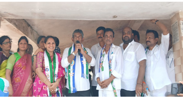
నేల్లూరు జిల్లా సైదాపురం (బిఎన్ఎస్):--ఆంధ్రప్రదేశ్ రాష్ట్ర వ్యాప్తంగా వైస్సార్ కాంగ్రెస్ పార్టీ అభ్యర్థులు వై.యస్. జగన్