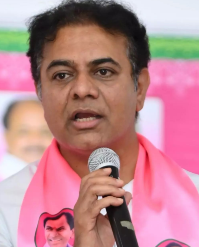
కుంభకోణంపై ఒకవేళ విచారణ జరపకపోతే కార్మికోకంటే కలిసి కేంద్రరాష్ట్ర ప్రభుత్వాలపై బీఆర్ఎస్ పార్టీ జంగ్ సైరన్ మోగిస్తుందని హెచ్చరించారు.

దగ్గర ఆ బొగ్గు లేకపోవడమే ఈ కుంభకోణానికి అతిపెద్ద ఆధారమని కటిఆర్ పేర్కొన్నారు. ఈ మొత్తం వ్యవహారంలో కేంద్రం, రాష్ట్రం కలిసి లక్షల టన్నుల తెలంగాణ బొగ్గును పక్కదారి పట్టించాయా అనే బలమైన అనుమానం కార్మికోకాన్ని వెంటాడుతోందన్నారు. ఈ స్థానం దాచిపెట్టే కుట్రలు కొనసాగుతున్న నేపథ్యంలో కేంద్ర ప్రభుత్వానికి చిత్తశుద్ధి ఉంటే వెంటనే ఒక అఖిల పక్షాన్ని ఆయా గనుల పద్ధతుల పంపాలని బీఆర్ఎస్ పక్షాన డిమాండ్ చేస్తున్నామని కటిఆర్ లేఖలో పేర్కొన్నారు.