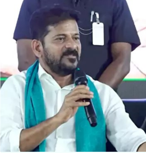
మహబూబ్ నగర్, జూన్ 5 (బిఎన్ఎస్):

ఉమ్మడి మహబూబ్ నగర్ జిల్లాలో సాగునీటి ప్రాజెక్టుల పనులను ముఖ్యమంత్రి రేవంత్ రెడ్డి పరిశీలించారు. రెండో రోజు పర్యటనలో భాగంగా పాలమూరు--రంగారెడ్డి ఎత్తిపోతల పథకం, కల్వకుర్తి ప్రాజెక్టు పనులను ఆయన ప్రత్యక్షంగా చూశారు. అనంతరం కరివెల రిజర్వాయర్ వద్ద మీడియాతో మాట్లాడారు.