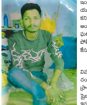
చందానగర్: (బిఎన్ఎస్): కుటుంబ సభ్యులకు చెప్పకుండా ఇంట్లోని అల్కారాల్లో ఉన్న

□ 20 రోజులుగా ఆహాకీ గల్లంతు □ చందానగర్ పోలీసుల గాలింపు.. సమాచారం ఇవ్వాలని విజ్ఞప్తి