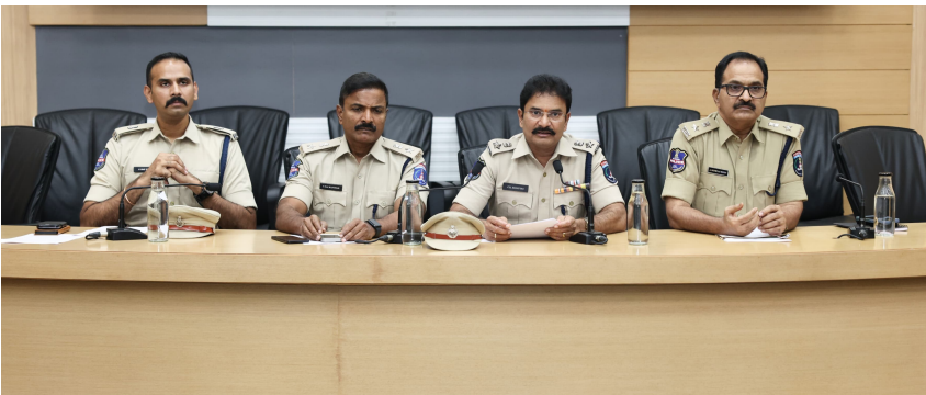
విలేజరుల సమావేశంలో వివరాలు వెల్లడిస్తున్న పోలీసు అధికారులు.

శేరిలింగంపల్లి: (బీఎన్ఎస్): ప్రభుత్వ భూమిని కాజేయడానికి నకిలీ జీవోలు సృష్టించి కోట్ల రూపాయల భూ దందాకు పాల్పడిన మూలా గుట్టును సైబరాబాద్ పోలీసులు బట్టబయలు చేశారు. గండిపేట గ్రామంలోని ప్రభుత్వ పోలీస్ కు భూమిని తమదిగా చూపిస్తూ నకిలీ పత్రాలు తయారు చేసి, ఎకరాకు రూ.3.5 కోట్ల చొప్పున విక్రయించేందుకు కుట్ర వచ్చిన ముగ్గురిని నార్సింగ్ పోలీసులు అరెస్ట్ చేశారు. ఈ వ్యవహారంలో మరికొందరు నిందితులు హాసీల్లో ఉండగా, వారి కోసం ప్రత్యేక బృందాలు గాలింపు చేపట్టాయి.