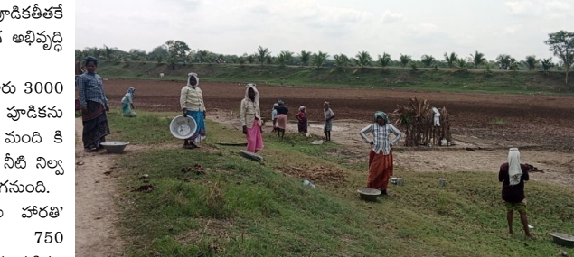
అయకట్టుకు ఇక్కడ సాగునీటికి ధోళా ఉండదు. 750 వంట కాలువలు రిపేరు వరి రైతులకు ఇది సంతోషాల మారనుంది. భూగర్భ జలాల పెంపు: చెరువులో నీరు నిల్వ ఉండటం వల్ల చుట్టుపక్కల బోరుబావుల్లో నీటి మట్టం పెరిగి, వేసవిలో కూడా తాగునీటి ఎద్దడి తలెత్తదు.

అనకాపల్లి మే 20 గా: భారత ప్రధానమంత్రి ప్రోత్సాహంతో మరయు గౌరవ ఆంధ్రప్రదేశ్ ముఖ్యమంత్రివర్యుల ఆదేశాలతో రాష్ట్రవ్యాప్తంగా సాగుతున్న 'జల హారతి' కార్యక్రమంలో భాగంగా నర్సీపట్నం మండలంలోని చెట్టుపల్లి గ్రామంలో మూలపు గొలుసు కట్టు చెరువు సరికొత్త రూపురేఖలను సంతరించుకుంటోంది. దశాబ్దాలుగా పూడికతో నిండిన ఈ గొలుసు కట్టు చెరువు జిల్లా కలెక్టర్ విజయ కృష్ణన్ ప్రణాళిక ప్రకారమ జలవనరుల శాఖ వారి సౌలభ్యం తో పునరుద్ధరించడం ద్వారా ఈ ప్రాంత రైతాంగం మరియు జీవితాల్లో సరికొత్త వెలుగులు నింపేందుకు ప్రభుత్వం శ్రీకారం చుట్టింది. ప్రధాన అభివృద్ధి పనులు: మహాత్మా గాంధీ జాతీయ గ్రామీణ ఉపాధి హామీ పథకం ద్వారా ఈ గొలుసు కట్టు చెరువు 'బలధార' పథకం లో ఈ పనులు కొనసాగుతున్నాయి చెరువు 1000 మీటర్లు పొడవునా పనులు చేపడుతున్నారు ఈ పనులు కేవలం పూడికతీతకే పరిమితం కాకుండా, సుమగ్ర అభివృద్ధి దిశగా సాగుతున్నాయి: సామర్థ్యం పెంపు: సుమారు 3000 క్యూబిక్ మీటర్లు పూడికను తొలగించడం ద్వారా 300 మంది కి జీవనోపాధి కల్పిస్తూ చెరువు నీటి నిల్వ సామర్థ్యం గణనీయంగా పెరగనుంది. బలమైన కట్టలు: 'జల హారతి' కార్యక్రమంలో భాగంగా 750 వంటకాలువల చెరువు గట్టును పటిష్టం చేసి, రాబోయే వర్షాకాలంలో ఎటువంటి గండ్లు పడకుండా రక్షణ చర్యలు చేపట్టారు. పర్యావరణ సుందరీకరణ: చెరువు గట్టు గట్టు పునరుద్ధరణ వంటి పనులు 750 వంట కాలువలు మరమ్మత్తులు చేపట్టడం అయినది. ఊతం: ఈ చెరువు కింద ఉన్న సుమారు 22 ఎకరాల