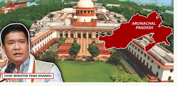
CHIEF MINISTER PEMA KHANDU

న్యూస్ డెస్క్, 06 ఏప్రిల్ (టిఎన్ఎస్): అరుణాచల్ ప్రదేశ్ సీఎం పెమా ఖండాకు దేశ అత్యున్నత న్యాయస్థానం సుప్రీంకోర్టు లో చుక్కెదురైంది. అధికార దుర్వినియోగానికి పాల్పడి, కుటుంబ సభ్యులకు చెందిన కంపెనీలకు భారీ ఎత్తున ప్రభుత్వ కాంట్రాక్టులను కట్టబెట్టారనే ఆరోపణలపై సీబీఐ ప్రాథమిక విచారణకు సుప్రీంకోర్టు ఇవాళ పుష్టమైన ఆదేశాలు జారీ చేసింది సోమవారం ఆదేశించింది. మొత్తం అక్రమాలపై ప్రాథమిక విచారణ జరిపి 16 వారాల్లోపు నివేదికను సమర్పించాలని సీబీఐని జస్టిస్ విక్రమ్ నాథ్ నేతృత్వంలోని ధర్మాసనం ఆదేశించింది. విచారణకు సంబంధించిన ఎలాంటి రికార్డులు ధ్వంసం కాకుండా చూడాలని అరుణాచల్ ప్రదేశ్ ప్రభుత్వ ప్రధాన కార్యదర్శిని కోర్టు ఆదేశించింది. ఈ క్రమంలోనే గడిచిన పదేళ్లలో ఖండా బంధువుల సంస్థలకు దక్కిన ప్రతి వర్క్ ఆర్డర్ ను సీబీఐ క్షుణ్ణంగా పరిశీలించనుంది. రాష్ట్ర పోలీసులు ఈ కేసును నిష్పక్షపాతంగా విచారించలేరని, కాబట్టి స్వతంత్ర దర్భాప్య సంస్థ అయిన సీబీఐతో విచారణ జరిపించడం అవసరమని కోర్టు అభిప్రాయపడింది. ఈ పరిణామం అరుణాచల్