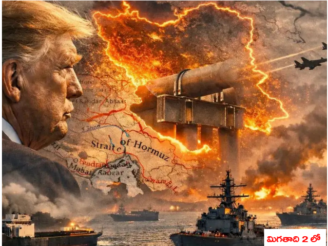
మగతాది 2 లో

న్యూస్ డెస్క్, 06 ఏప్రిల్ (టిఎన్ఎస్): విధించిన పశ్చిమాసియా మరో భారీ యుద్ధం అంచన నిలబడింది. ఇరాన్, అమెరికా మధ్య ఉద్రిక్తతలు వతాక స్థాయికి చేరిన వేళ, 45 రోజుల పాటు తాత్కాలిక 'సీజ్ ఫైర్' ఒప్పందాన్ని ఖరారు చేసేందుకు అంతర్జాతీయ మధ్యవర్తులు తీవ్రంగా క్రమిస్తున్నారు. అయితే, ఈ ఒప్పందం కుదిరేందుకు మరింత సమయం పడుతుందని.. మరోవైపు జరగాల్సిన నష్టం జరిగిపోతోందని దౌత్య వర్గాలు పేర్కొంటున్నాయి. ట్రంప్ హెచ్చరిక.. గడువు పొడిగించు: అమెరికా అధ్యక్షుడు డొనాల్డ్ ట్రంప్ ఇరాన్ కు