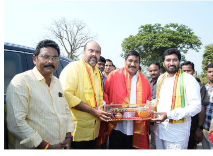
విజయనగరం జిల్లా బొబ్బిలి నియోజకవర్గంలో బొబ్బిలి రామభద్రపరం మార్గంలో మేగావతి నదిపై నిర్మిస్తున్న పాదాధి వంతెన నిర్మాణ పనులను ఆర్ & బి శాఖ మంత్రి బీసీ జనార్ధన్ రెడ్డి స్వయంగా పరిశీలించారు.

బొబ్బిలి నియోజకవర్గం విస్తీర్ణ మంత్రి బీసీ జనార్ధన్ రెడ్డికి ఘన స్వాగతం పలికి, బొబ్బిలి వీణను స్థానిక ఎమ్మెల్యే ఆర్.వి.ఎస్.కె.కె. రంగారావు (జేపీ నాయన) అందచేశారు. బ్రిడ్జి నిర్మాణ పనులు జరుగుతున్న తీరుతెన్నులను ప్రత్యక్షంగా పరిశీలించారు. బ్రిడ్జి నిర్మాణ పనులను త్వరితగతిన పూర్తి చేసి ప్రజలకు అందుబాటులోకి తీసుకురావాలని మంత్రి ఆదేశించారు. నాణ్యత ప్రమాణాల్లో రాజీపడకుండా బ్రిడ్జి నిర్మాణ పనులు చేపట్టాలని మంత్రి సూచించారు. ఈ సందర్భంగా మంత్రిని కలిసిన ప్రజాప్రతినిధులు స్థానికంగా తమ ప్రాంతంలో రహదారుల సమస్యను విన్నవించారు. తన దృష్టికి తీసుకువచ్చిన ఆయా రోడ్లను రాలోయే రోజుల్లో అభివృద్ధి చేస్తామని హామీ ఇచ్చారు. కూటమి ప్రభుత్వం ప్రజలకు మెరుగైన, సౌకర్యవంతమైన రహదారుల కల్పనకు కృషి చేస్తోందని మంత్రి అన్నారు.