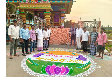
మన రాష్ట్రం ఆంధ్రప్రదేశ్ మనరాజధాని అమరావతి

కొత్తపేట. (బిఎన్ఎస్). ఏప్రిల్ 5 రాష్ట్ర రాజధాని అమరావతికి చట్ట భద్రత కల్పించడంతో పలివెల గ్రామంలో సంబరాలు నిర్వహించారు. ఊరంతా ముగ్గులు పెట్టి ఆనందాన్ని బాటుకున్నారు. గ్రామ పెద్దల ఆధ్వర్యంలో అందరికీ స్వీట్లు పంచారు.