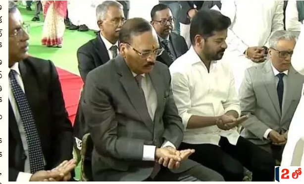
ప్రభుత్వం నిర్మిస్తున్న విషయం తెలిసిందే. అత్యధునిక సాంకేతిక పరిజ్ఞానంతో నిర్మితమవుతున్న ఈ జోన్-2 భవనం ద్వారా న్యాయ సేవల వేగం మరింత పెరుగుతుందని అధికారులు వెల్లడించారు.

న్యూస్ డెస్క్, 05 ఏప్రిల్ (బిఎన్ఎస్): తెలంగాణ న్యాయ వ్యవస్థ చరిత్రలో అదివారం మరో కీలక అడుగు పడింది. రంగారెడ్డి జిల్లా రాజేంద్రనగర్ పరిధిలోని బుద్వేల్లో అత్యున్నత ప్రమాణాలతో నిర్మించనున్న హైకోర్టు జోన్-2 భవన నిర్మాణ పనులకు సుప్రీంకోర్టు న్యాయమూర్తి జస్టిస్ సూర్యకాంత్ శంకుస్థాపన చేశారు. ముఖ్యమంత్రి రేవంత్ రెడ్డి సమక్షంలో జరిగిన ఈ కార్యక్రమంలో సుప్రీంకోర్టు, హైకోర్టుకు చెందిన పలువురు ప్రముఖ న్యాయమూర్తులు పాల్గొన్నారు. సుమారు 100 ఎకరాల విస్తీర్ణంలో రూపుదిద్దుకుంటున్న ఈ నూతన ప్రాంగణంలో అత్యధునిక వసతులతో కూడిన కోర్టు గదులు, డిజిటల్ లైబ్రరీలు, పరిపాలనా విభాగాలు అందుబాటులోకి రానున్నాయి. ఈ ప్రాజెక్టులో భాగంగా రెండో దశలో న్యాయమూర్తుల క్వార్టర్స్ నిర్మాణాన్ని ప్రతిష్ఠాత్మకంగా చేపట్టనున్నారు. ప్రస్తుతం ఉన్న హైకోర్టు భవనం వారసత్వ కట్టడంగా ఉన్నందున, భవిష్యత్తు అవసరాలకు అనుగుణంగా బుద్వేల్లో ఈ కొత్త కాంప్లెక్స్ ను