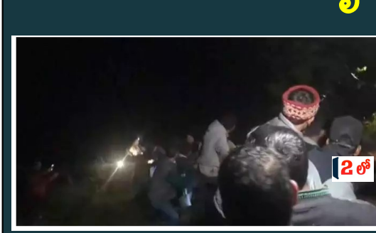
న్యూస్ డెస్క్, 05 ఏప్రిల్ (బిఎన్ఎస్): పర్యాటకులతో వెళ్తున్న వాహనం అర్ధరాత్రి అదుపుతప్పి లోయలో పడిపోవడంతో నలుగురు ప్రాణాలు కోల్పోయారు. ఈ షాకింగ్ ఘటన హిమాచల్ ప్రదేశ్ లోని కులు జిల్లాలో శనివారం రాత్రి దాదాపు తర్వాత చోటు చేసుకుంది. ఈ ప్రమాదంలో మృతి చెందిన వారిలో ఇద్దరు మహిళలు ఉన్నారు. ఈ ప్రమాదంలో మరో 14 మంది తీవ్రంగా గాయపడ్డారు.