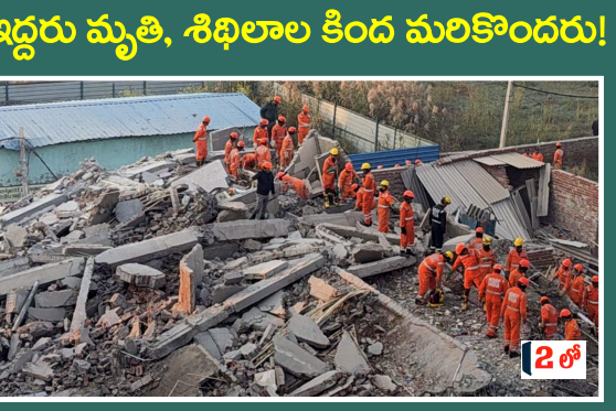
న్యూస్ డెస్క్, 05 ఏప్రిల్ (బిఎన్ఎస్): భారీ భవనం కుప్పకూరి ఇద్దరు ప్రాణాలు కోల్పోగా మరొకరికి శిథిలాల కింద చిక్కుకున్నారు. ఈ షాకింగ్ ఘటన శనివారం రాత్రి మధ్యప్రదేశ్ లోని అనుప్పూర్ జిల్లా కోల్కా పట్టణంలో చోటు చేసుకుంది.