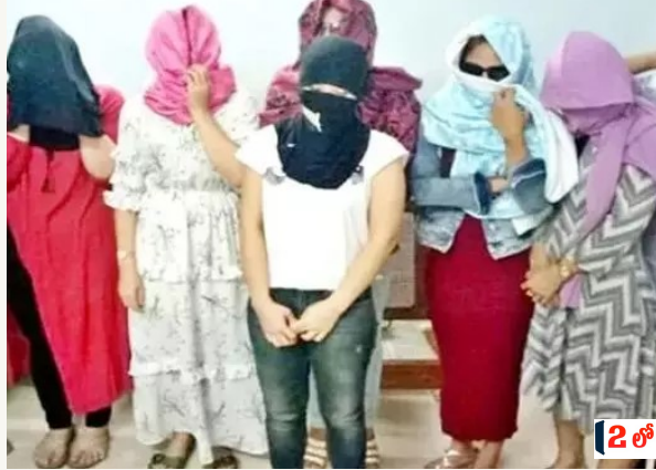
పోలీసులకు చిక్కపాపం గమనార్హం. మహబూబ్ నగర్ జిల్లా పరిధిలో సుమారుగా రెండువేల మందికి పైగా కాంటాక్ట్ తో ఈ దందాను గుట్టుగా సాగిస్తున్నారు. గత వారం రోజుల క్రితం పోలీస్ దాడులతో పట్టుబడిన సదరు వ్యక్తి సైఫన్ బెయిల్ తీసుకుని మళ్లీ దందా పురా చేసినట్లు సమాచారం.

న్యూస్ డెస్క్, 05 ఏప్రిల్ (బిఎన్ఎస్): మహబూబ్ నగర్ జిల్లా కేంద్రంలో భారీ వ్యభిచార సామాజ్యం విస్తరించింది. మహబూబ్ నగర్ జిల్లా కేంద్రంలోని నడిబొడ్డున అశోక్ టాకీస్ ప్రాంతంలో పోలీసుల దాడులతో ఏడుగురు విలులతో పాటు ఇద్దరు మహిళలు దొరకడం విస్తయానికి గురిచేస్తుంది. పోలీసులు నిత్యం గస్తీ నిర్వహించే అశోక్ టాకీస్ వంటి రద్దీ ప్రాంతాలు, నివాస గృహాలు అధికంగా ఉండే మర్దు, బైపాస్ రోడ్డు ప్రాంతాలను కూడా తమ అధ్యక్షులు మార్చుకున్న సదరు వ్యక్తులు వేలాది మంది విలులతో ఒక వ్యవస్థీకృత నేర సామ్రాజ్యాన్ని నిర్మించినట్లు సమాచారం. మాడంచెల భద్రత.. కోడింగ్ భాష!