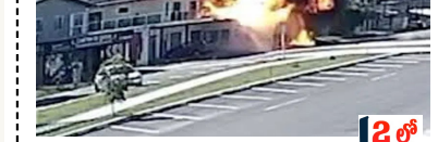
న్యూస్ డెస్క్, 05 ఏప్రిల్ (బిఎన్ఎస్): బ్రెజిల్ లో ఓ రెస్టారెంట్ లోకి విమానం దూసుకెళ్లింది. ఈ ప్రమాదంలో నలుగురు ప్రాణాలు కోల్పోయారు. ఈ ఘటనకు సంబంధించిన దృశ్యాలు సామాజిక మాధ్యమాల్లో చక్కర్లు కొడుతున్నాయి. దక్షిణ బ్రెజిల్ లో శుక్రవారం ఈ ఘటన జరిగింది. ఒక విమానం ఆరుగురితో కావో దా కానావో విమానాశ్రయం నుంచి బయలుదేరింది.